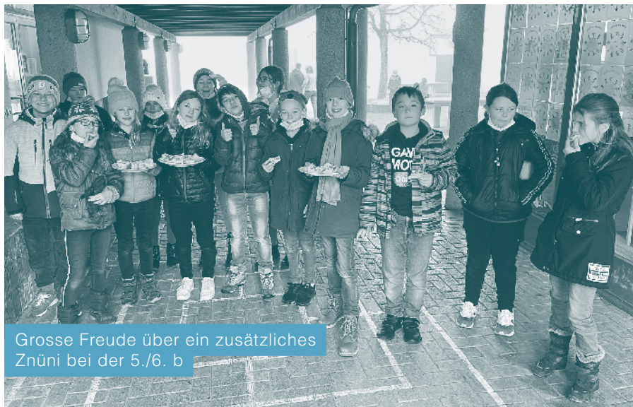
Grosse Freude über ein zusätzliches Znüni bei der 5./6. b

Die Schülerinnen und Schüler der 5./6. Klassen bauten im September ihren eigenen Schulgarten und beobachteten das Wachsen des Salates und der Radieschen. Die geernteten Radieschen wurden Mitte Januar auf Brote gelegt und alle erfreuten sich am besonderen «Znüni» in der Pause. In heiterer Stimmung verbrachten sie die Pause und einige nahmen noch Radieschen für den Salat mit nach Hause.