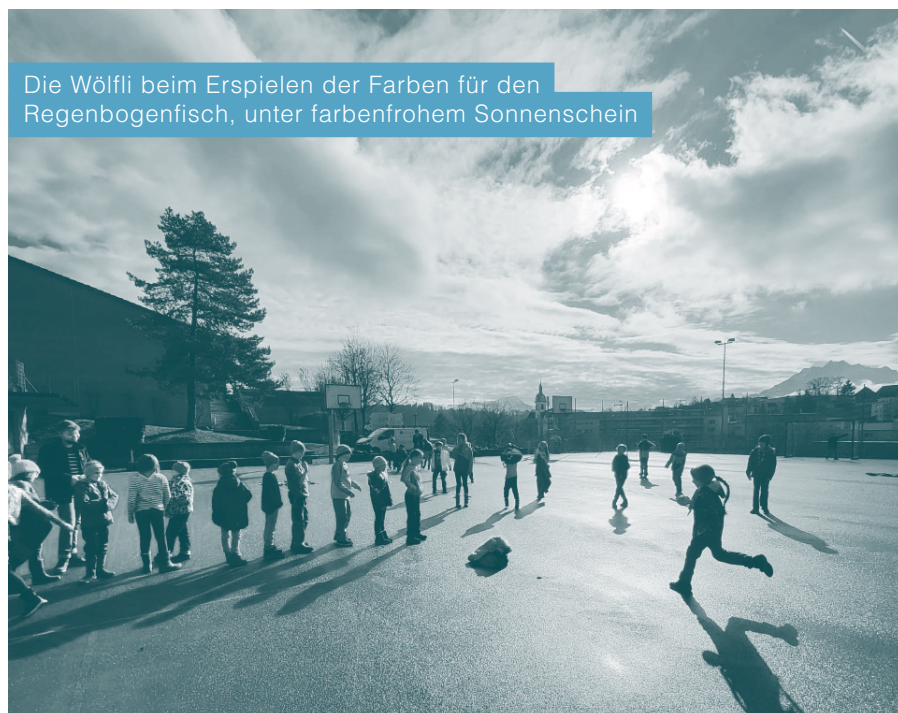
Die Wölfli beim Erspielen der Farben für den Regenbogenfisch, unter farbenfrohem Sonnenschein

Das neue Pfadi-Jahr hat dort angefangen, wo ich gerade diesen Text schreibe: Am Bildschirm. Denn wir haben uns entschieden, die GV unseres Vereins per Zoom durchzuführen. Was wir aber glücklicherweise nicht online durchführen mussten, waren die Anlässe mit den Teilnehmenden – und so konnten wir den Samstagnachmittag jeweils mit Verkleidung und (u.a. Hygiene-)Masken zu einem veritablen Glücksmoment verwandeln!