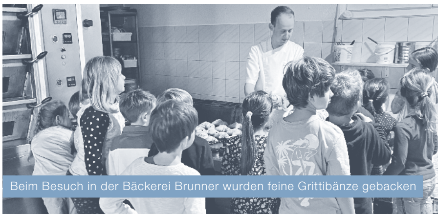
Beim Besuch in der Bäckerei Brunner wurden feine Grittibänze gebacken