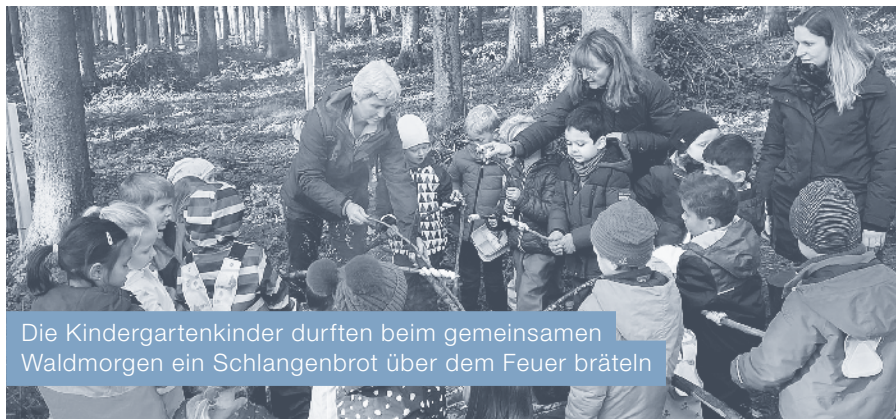
Die Kindergartenkinder durften beim gemeinsamen Waldmorgen ein Schlangenbrot über dem Feuer bräteln

Die drei Kindergärten durften zusammen einen tollen Waldmorgen erleben. Bei bestem Wetter spazierten wir in den Eggwald. Die Kinder hatten viel Zeit, den Wald zu entdecken. Einige unterstützten die Lehrpersonen beim Feuer machen. Anschliessend machten sich die Kinder auf die Suche nach einem Stock, um da-