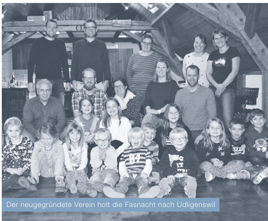
Der neugegründete Verein holt die Fasnacht nach Udligenswil