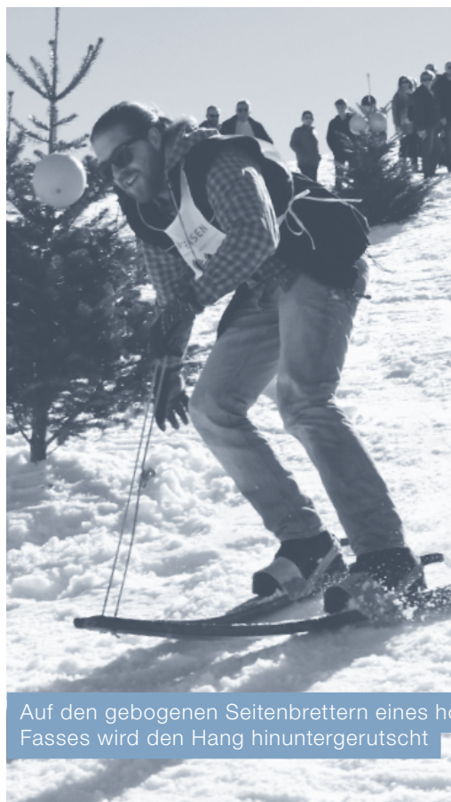
Auf den gebogenen Seitenbrettern eines hölzernen Fasses wird den Hang hinuntergerutscht