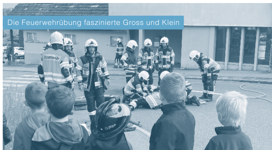
Die Feuerwehrübung faszinierte Gross und Klein