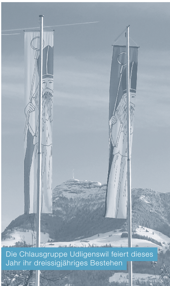
Die Chlausgruppe Udligenswil feiert dieses Jahr ihr dreissigjähriges Bestehen