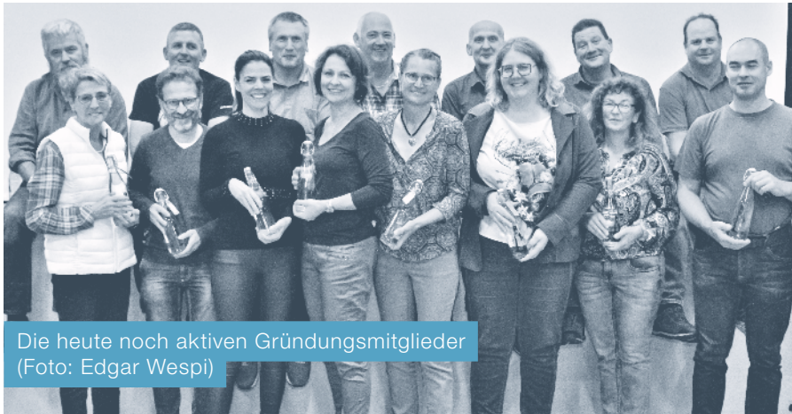
Die heute noch aktiven Gründungsmitglieder (Foto: Edgar Wespi)

Bereits seit dreissig Jahren pflegt die Chlausgruppe Udligenswil das Brauchtum des Samichlaus und verbreitet mit dieser Tradition eine besondere Stimmung im Dorf.