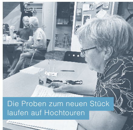
Die Proben zum neuen Stück laufen auf Hochtouren

Waren Sie schon mal auf einem Campingplatz in den Ferien? Die Komödie in zwei Akten von Marcel Schlegel, bearbeitet durch Martin Dahinden, der auch Regie führt, lässt Sie den Campingplatz in all seiner schönen, spannenden und überraschenden Vielseitigkeit erleben. Von Jahresplatz-Campers über Tratschtanten bis hin zu speziellen Neuankömmlingen. Die Liebe kommt selbstverständlich auch nicht zu kurz, muss aber bei Vater Wipf hart erarbeitet und eine überraschende Erkenntnis als «Überzeugungshilfe» genommen werden.