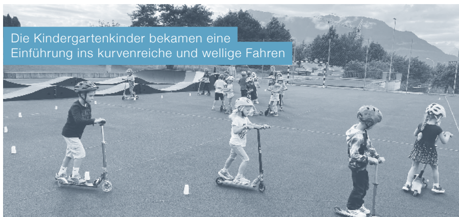
Die Kindergartenkinder bekamen eine Einführung ins kurvenreiche und wellige Fahren

Von 24. Juni bis 4. August 2022 stand der mobile Pumptrack der Bevölkerung und besonders den Kindern von Udligenswil zur Verfügung. Viele Kinder genossen die Fahrten auf der mobilen Strecke. Der Pumptrack wurde sowohl in den Pausen als auch während dem Unterricht und in den Ferien rege genutzt.