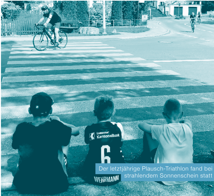
Der letztjährige Plausch-Triathlon fand bei strahlendem Sonnenschein statt

und Samariter, Helfer beim Grill- und Getränkestand, Speaker, Fotografen und Fahrer vom Material- und Besenwagen.