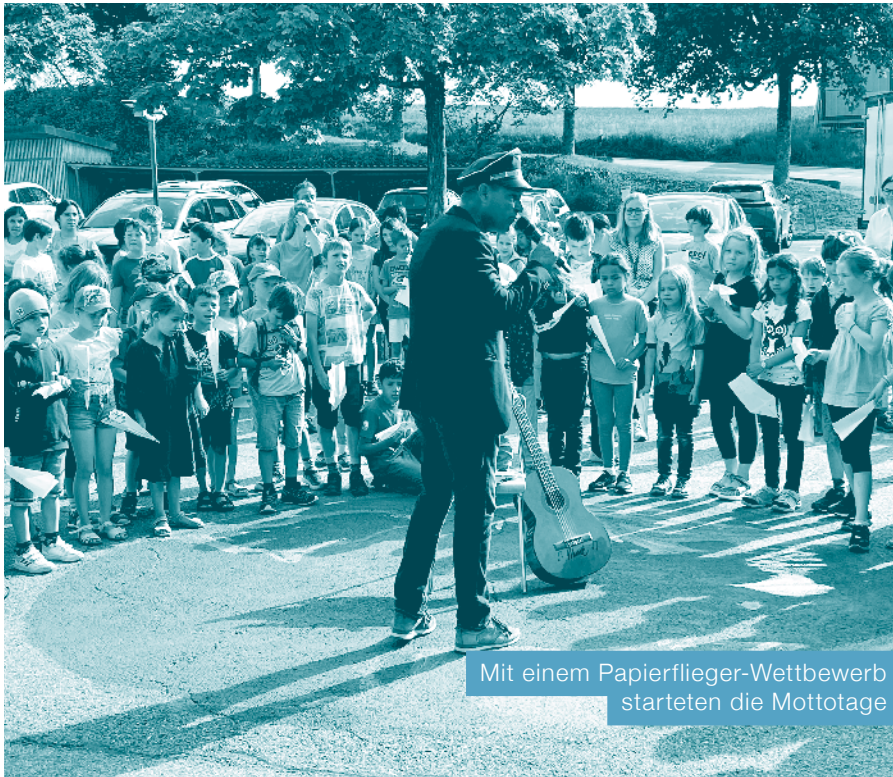
Mit einem Papierflieger-Wettbewerb starteten die Mottotage

Das Jahresmotto «Rund um d'Wält» wurde Ende Mai an der ganzen Schule zelebriert. An den Mottotagen konnten unsere SchülerInnen verschiedene Länder und Kulturen kennenlernen.