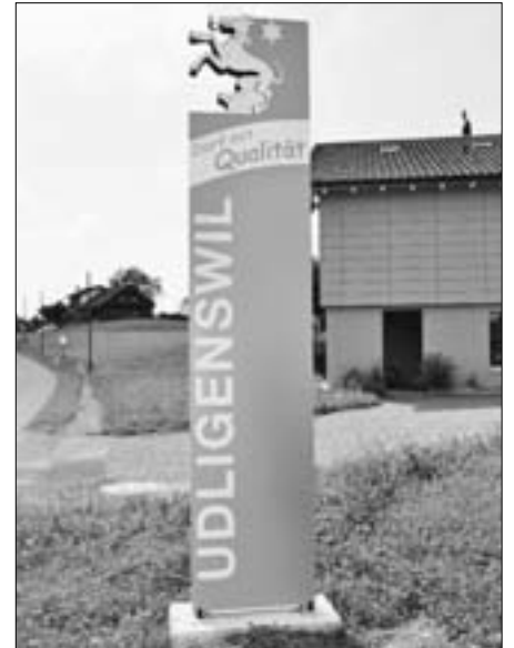
Die neuen «Stelen» an den drei Einfahrtsstrassen ins Dorf Udligenswil