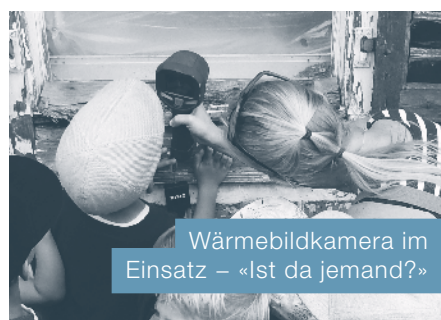
Wärmebildkamera im Einsatz – «Ist da jemand?»

Erfreulich viele Interessierte jeden Alters nutzten die Gelegenheit für einen vielseitigen Einblick in die Arbeit der Feuerwehr am Tag der offenen Tore vom 31. August 2019: korrekte Handhabung einer Löschedecke, eindruckliche Vorführung bei falschem Verhalten bei einem Ölbrand und kommentierter Ablauf bei einem Hausbrand mit starker Rauchentwicklung. Weiter bot sich Gelegenheit, aus dem Korb der Autodrehleiter der Feuerwehr Küsnacht einen Blick über Udligenswil zu genießen, die Feuerwehrfahrzeuge aus nächster Nähe zu begutachten und die Entwicklung der Ausrüstung in den letzten Jahrzehn-