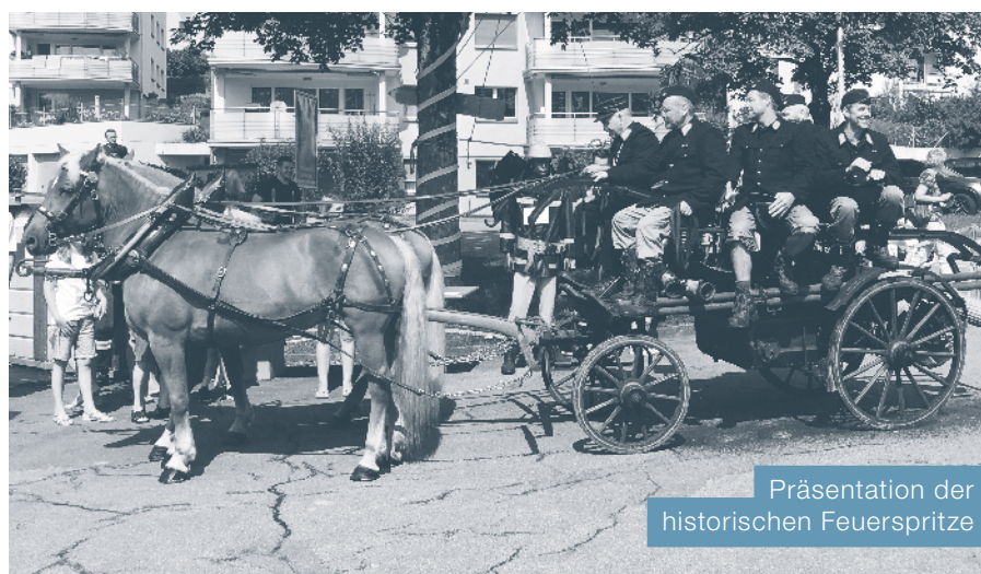
Präsentation der historischen Feuerspritze

Erfreulich viele Interessierte jeden Alters nutzten die Gelegenheit für einen vielseitigen Einblick in die Arbeit der Feuerwehr am Tag der offenen Tore vom 31. August 2019: korrekte Handhabung einer Löschedecke, eindruckliche Vorführung bei falschem Verhalten bei einem Ölbrand und kommentierter Ablauf bei einem Hausbrand mit starker Rauchentwicklung. Weiter bot sich Gelegenheit, aus dem Korb der Autodrehleiter der Feuerwehr Küsnacht einen Blick über Udligenswil zu genießen, die Feuerwehrfahrzeuge aus nächster Nähe zu begutachten und die Entwicklung der Ausrüstung in den letzten Jahrzehn-