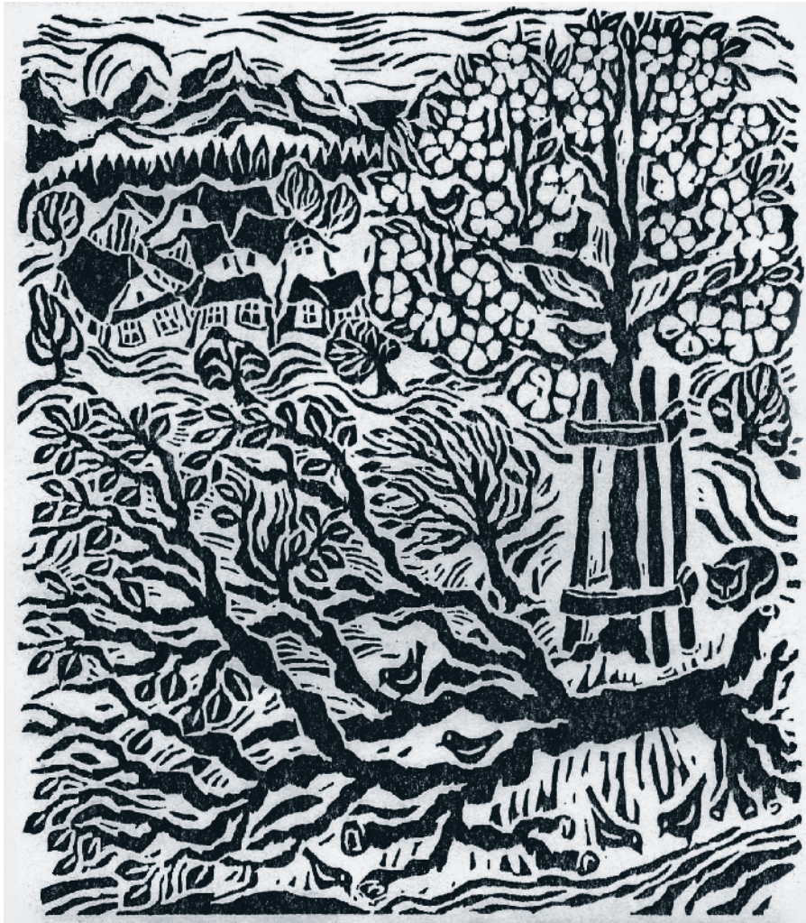
Holzschnitt von Theresia Greter-Lustenberger

In Frankreich forderten jüngst die «Gelbwesten» von der Regierung, dass sie die eben beschlossene Erhöhung der Benzinsteuern zurücknehme. Das Einlenken des Präsidenten liess die Proteste nicht abflauen. Während die Steuererhöhung der Funke war, welcher das Pulverfass zündete, liegt die wirkliche Problematik tiefer: ein Unbehagen gegen die Politik, die Ohnmacht des Bürgers gegenüber der Macht des Staates. In der kleinen, braven Schweiz gehört gewalttätiges Demonstrieren zur Kultur bloss weniger Extremistengruppen. Volkszorn äussert sich etwas subtiler. Doch selbst als «Regierender» der untersten Staatsebene spürt man bisweilen Unverständnis. Um gefällte Bäume ist es in Udligenswil gegangen. Ein Thema von relativer Wichtigkeit (der Gestaltungsplan, welcher den Ersatz dieser Bäume vorsieht, ist