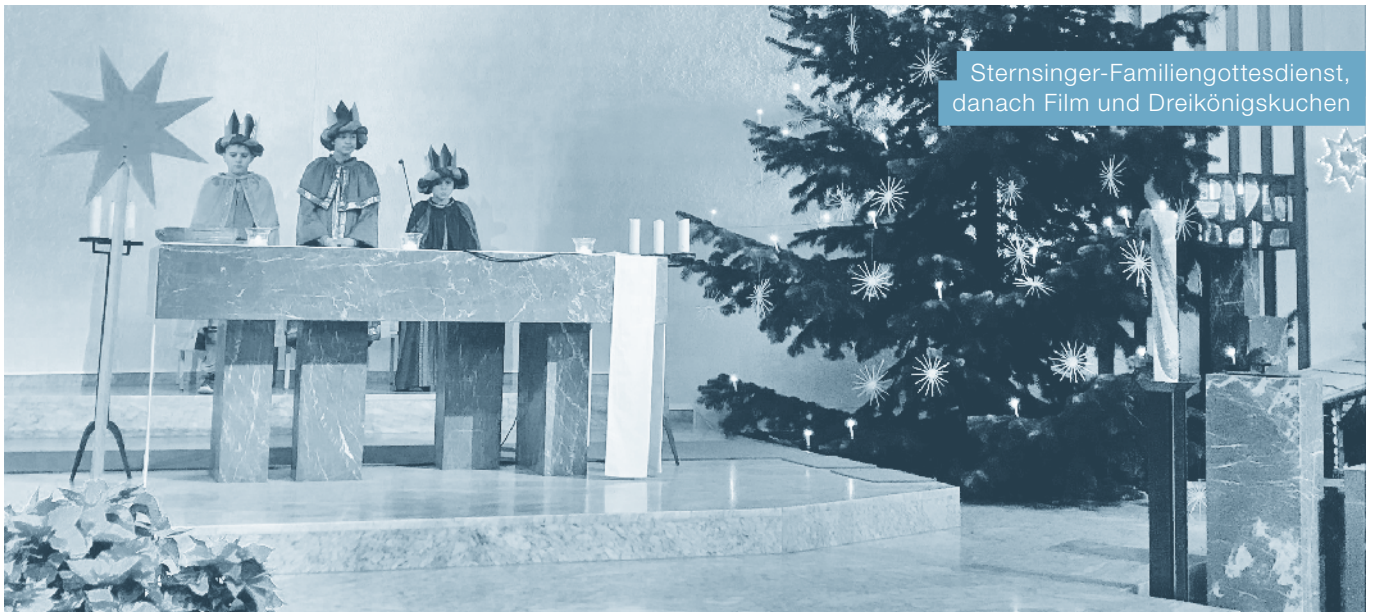
Sternsinger-Familiengottesdienst, danach Film und Dreikönigskuchen