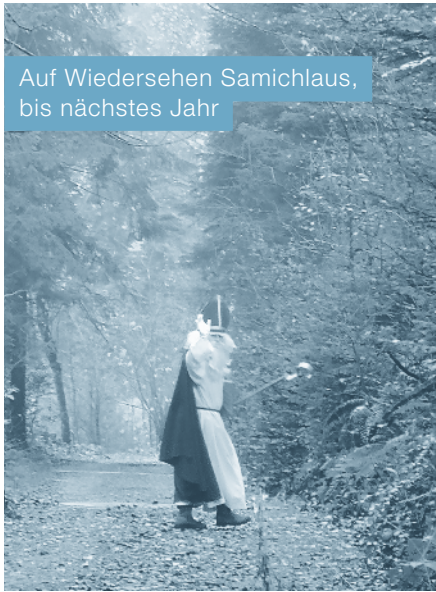
Auf Wiedersehen Samichlaus, bis nächstes Jahr

Freitagmorgen im Meggerwald nahe Udligenswil beim Zapfestübli-Plätzli. Heute ist ein ganz besonderer Morgen – der Samichlaus kommt zu uns. Eine schöne Anspannung liegt in der Luft. Die Kinder kommen, anders als sonst, mit ihren Mamis, Papis oder auch Grossmamis und Grosspapis direkt in den Wald.