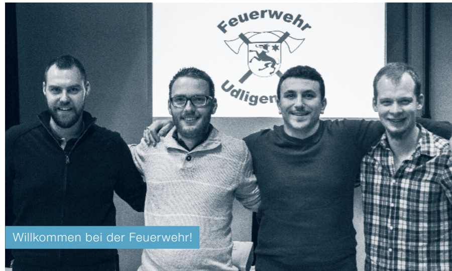
Willkommen bei der Feuerwehr!