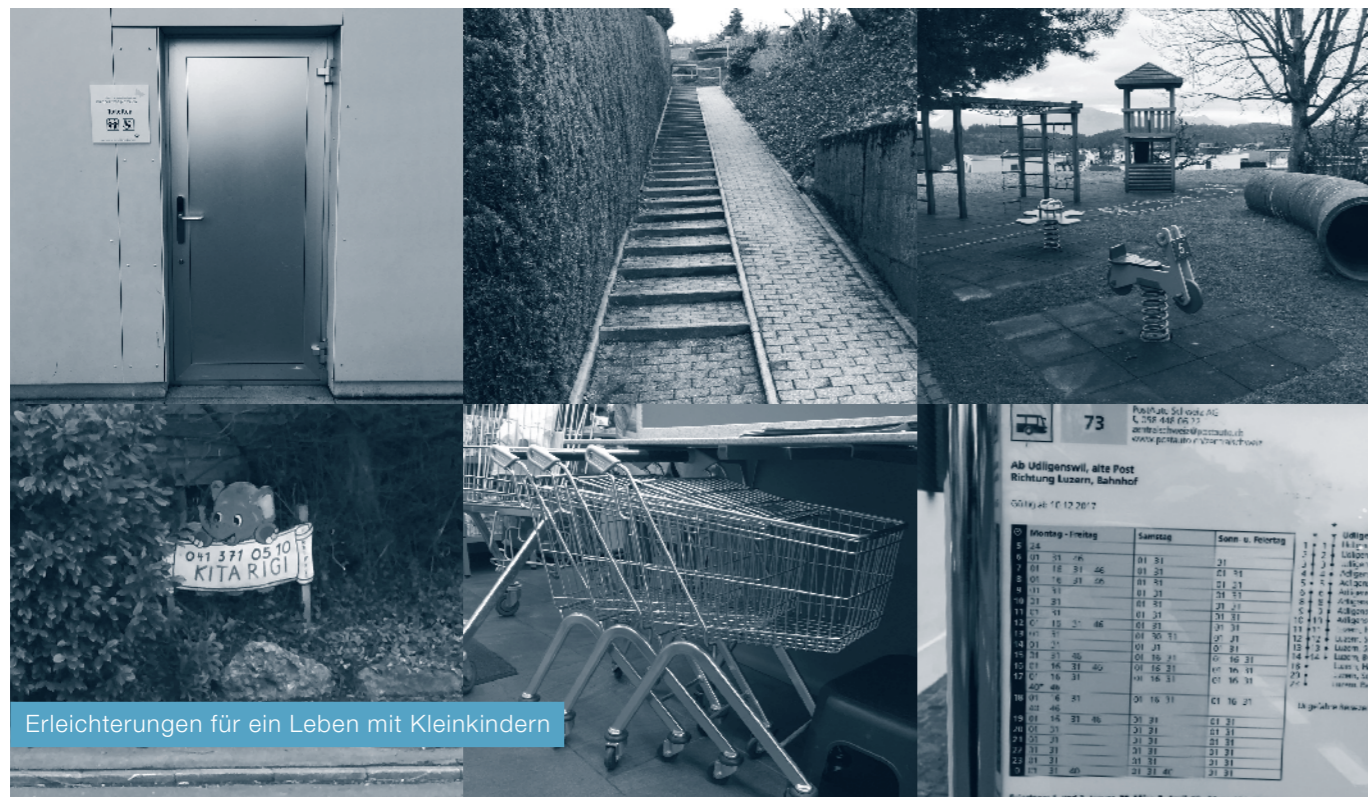
Erleichterungen für ein Leben mit Kleinkindern

Vor weniger als vier Jahren hätte ich niemals gedacht, wie sehr ich es heute als Mutter von zwei Kleinkindern an Uedlige schätze, dass