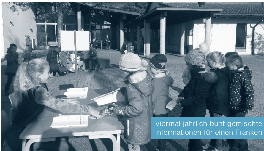
Viermal jährlich bunt gemischte Informationen für einen Franken