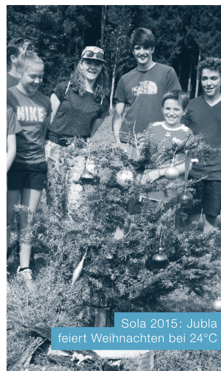
Sola 2015: Jubla feiert Weihnachten bei 24°C