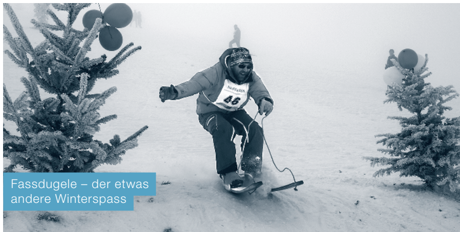
Fassdugeli – der etwas andere Winterspass

Das «Dugeli» oder zu gut Deutsch «Fassdauben-Skifahren» war früher gang und gäbe. In Udligenswil bietet der Fassdugeli-Club die Möglichkeit, diese fast vergessen gegangene Wintersportdisziplin auszuüben. Sobald auf dem Ochsenhang auf Michaelskreuz genug Schnee liegt, führen wir das beliebte Fassdugeli-Rennen durch. Dort können sich Erwachsene wie auch Kinder im Wettkampf messen.