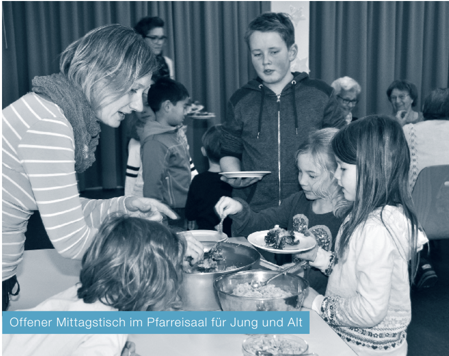
Offener Mittagstisch im Pfarreisaal für Jung und Alt

Als ich um 10.00 Uhr den Pfarreisaal betrat, hörte ich schon von weitem Gelächter aus der Küche. Die drei Frauen, welche für die Zubereitung des Essens zuständig waren, hatten bereits mit der Arbeit begonnen. Kartoffeln wurden gerüstet, Fleisch zu einem Hackbraten verarbeitet und Gemüse vorbereitet. Ich war im Service eingeteilt. Die zwei anderen Frauen, welche im Service mithalfen, kamen zeitgleich mit mir und nach gegenseitiger Begrüssung begannen auch wir mit der Arbeit. Wir stellten Tische und Stühle auf, dekorierten und deckten die Tische. Schon bald duftete es herrlich aus der Küche. Die drei Frauen hatten ein tolles «Hausfrauenmenu» gezaubert.