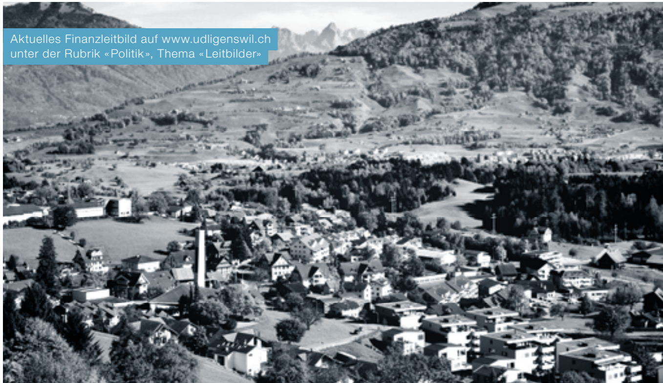
Aktuelles Finanzleitbild auf www.udligenswil.ch unter der Rubrik «Politik», Thema «Leitbilder»

Am 23. Juni 2017 hat der Gemeinderat ein neues Finanzleitbild genehmigt. Was ist neu? Auf den ersten Blick fällt auf, dass wir dem Kapitel «Ist-Situation» am meisten Platz eingeräumt haben und darin ausführlich berichten, welche Projekte die Gemeindefinanzen aktuell und in absehbarer Zukunft beeinflussen. Selbstverständlich dürfen eine Darstellung der Steuerkraftentwicklung und ein Vergleich der Steuerfüsse aller Gemeinden nicht fehlen. Die Darstellung der «Ist-Situation» ist deshalb wichtig, weil das Gemeinwesen aktuell einem stark ändernden Umfeld ausgesetzt ist. Wollen wir uns in ein paar Jahren an unseren Zielen messen, können wir so veränderte Rahmenbedingungen rückblickend besser erkennen.