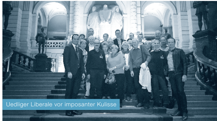
Uedliger Liberale vor imposanter Kulisse

Am Donnerstag, 14. September 2017 war die FDP Udligenswil eingeladen, das Bundeshaus zu besuchen. Mit dieser Einladung bedankte sich der liberale Ständerat Damian Müller für die Unterstützung der FDP Udligenswil während seines Wahlkampfes.