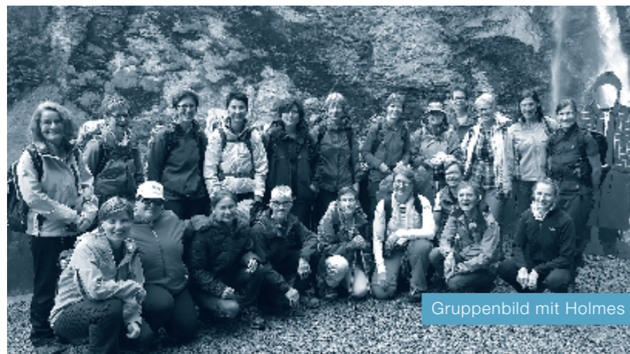
Gruppenbild mit Holmes

Die Anreise nach Meiringen am 9. September 2017 verging wie im Flug, denn 21 Frauen wissen sich einiges zu erzählen! Unsere Reisegruppe war bunt gemischt und die jüngste und älteste Teilnehmerin trennten stolze 45 Jahre.