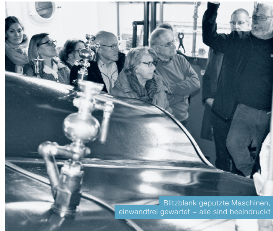
Blitzblank geputzte Maschinen, einwandfrei gewartet – alle sind beeindruckt

Dann warfen wir einen Blick in die mechanische Werkstatt. In mehrere