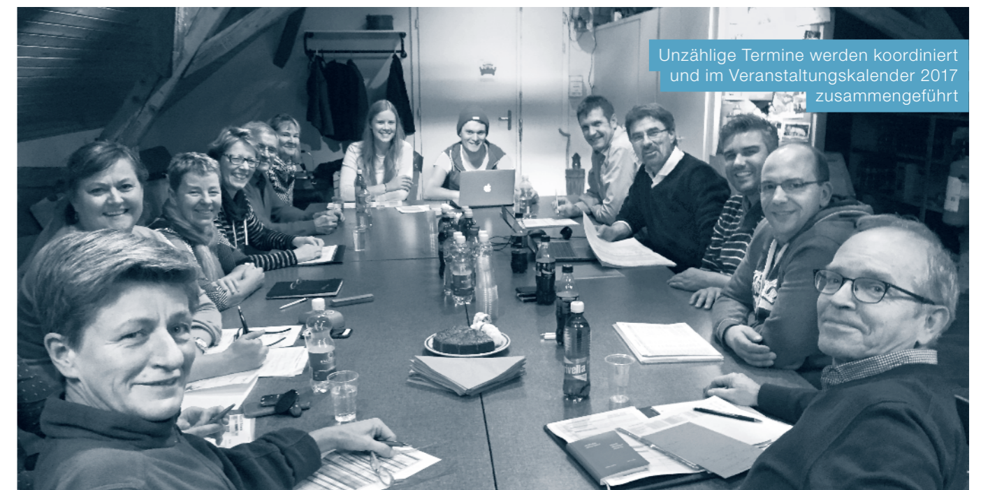
Unzählige Termine werden koordiniert und im Veranstaltungskalender 2017 zusammengeführt