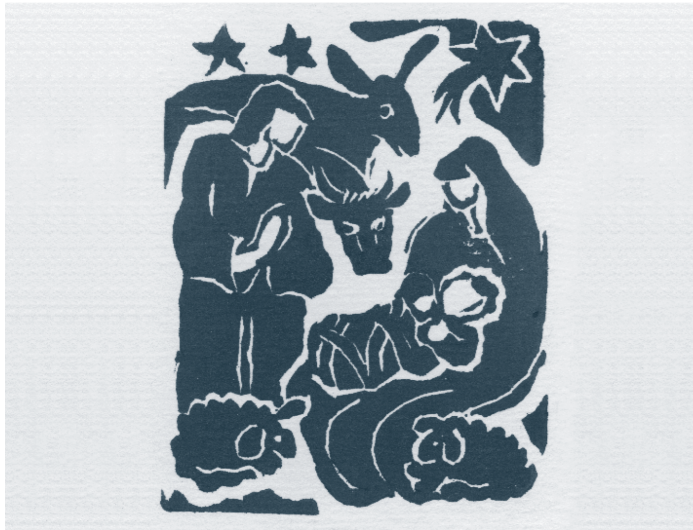
Holzschnitt von Theresia Greter-Lustenberger

Dank dir für das Geschenk! Seine Verpackung war so herzlich, dass ich es gar nicht öffnete.