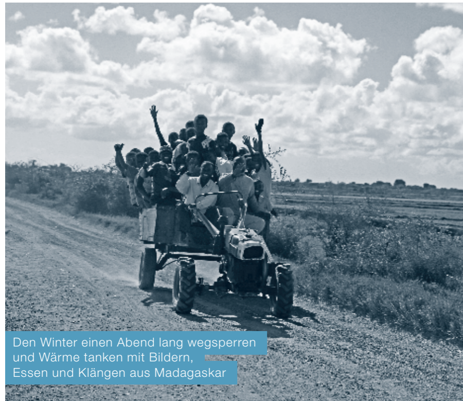
Den Winter einen Abend lang wegsperren und Wärme tanken mit Bildern, Essen und Klängen aus Madagaskar

Anmeldeschluss Montag, 6. Januar 2014 Platzzahl beschränkt