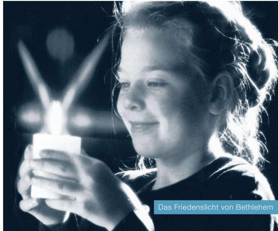
Das Friedenslicht von Bethlehem