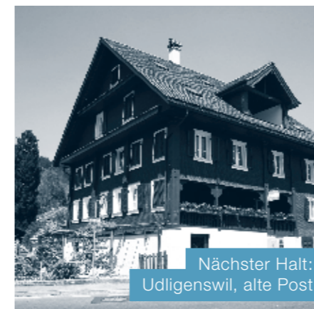
Nächster Halt: Udligenswil, alte Post

www.udligenswil.luzernmobil.ch bietet der Bevölkerung umfassende Informationen rund um das Thema Mobilität. Zudem finden Sie Informationen über das Mobilitätsangebot in Ihrer Gemeinde (Haltestellen, Buslinien, Park+Ride, Mobility, Gemeinde-GA und nachtstern).