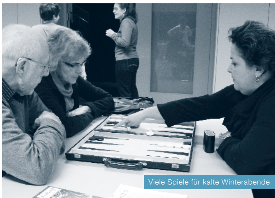
Viele Spiele für kalte Winterabende

Zum bevorstehenden Jahreswechsel möchten wir uns herzlich bei unseren Kundinnen und Kunden bedanken, die uns 2013 in der Ludothek besucht haben oder an einem unserer Anlässe (Spielnachmittag/Spielnacht) euphorisch mitgespielt haben.