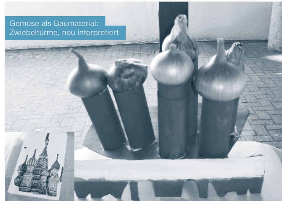
Gemüse als Baumaterial: Zwiebeltürme, neu interpretiert

Plakate gestalten, Würfelspiele basteln, Modelle entwerfen: Nach den Herbstferien sah der Mensch und Umwelt Unterricht für die Dritt- und Viertklässler der Schule Udligenswil vier Wochen lang etwas anders aus als gewohnt. Im Rahmen der Begabungsförderung, bei welcher es darum geht, jedes Kind in seinen Stärken und Interessen zu fördern, arbeiteten die Kinder an einem 7-Schritte-Projekt.