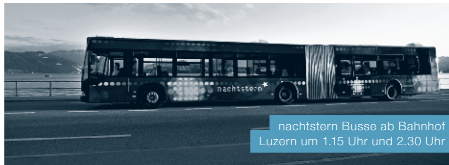
nachtstern Busse ab Bahnhof Luzern um 1.15 Uhr und 2.30 Uhr

Die Linienführung der Linie N7 nach Adligenswil-Udligenswil und Meierskappel wird angepasst. Die nachtstern-