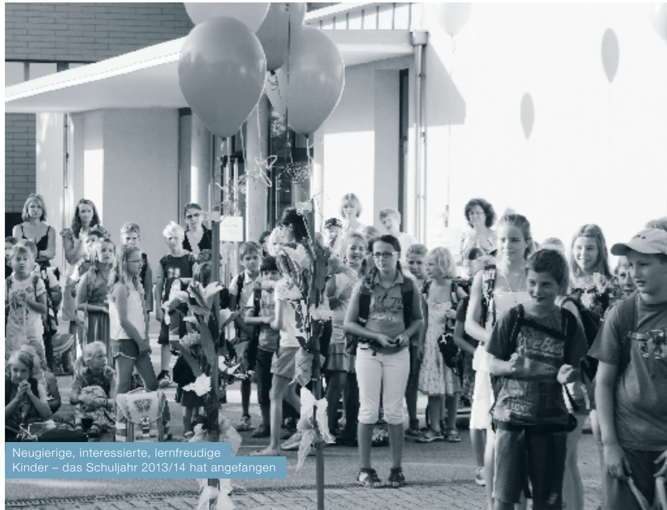
Neugierige, interessierte, lernfreudige Kinder – das Schuljahr 2013/14 hat angefangen