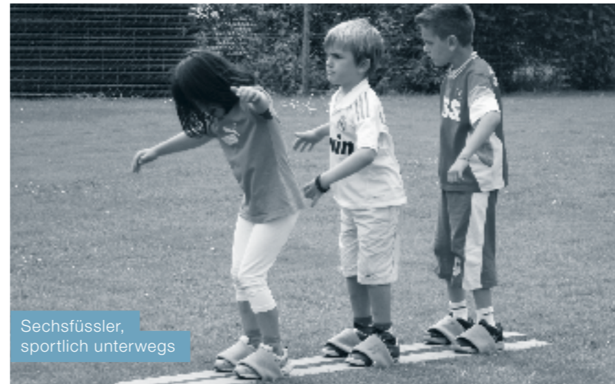
Sechsfüssler, sportlich unterwegs