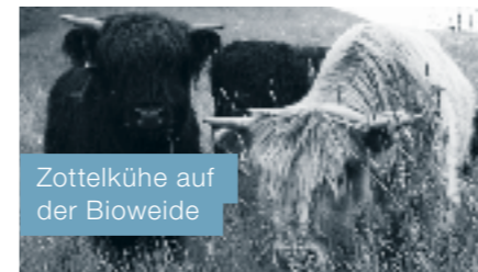
Zottelkühe auf der Bioweide