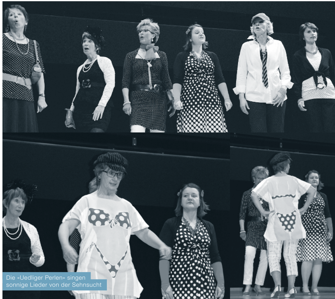
Die «Uedliger Perlen» singen sonnige Lieder von der Sehnsucht