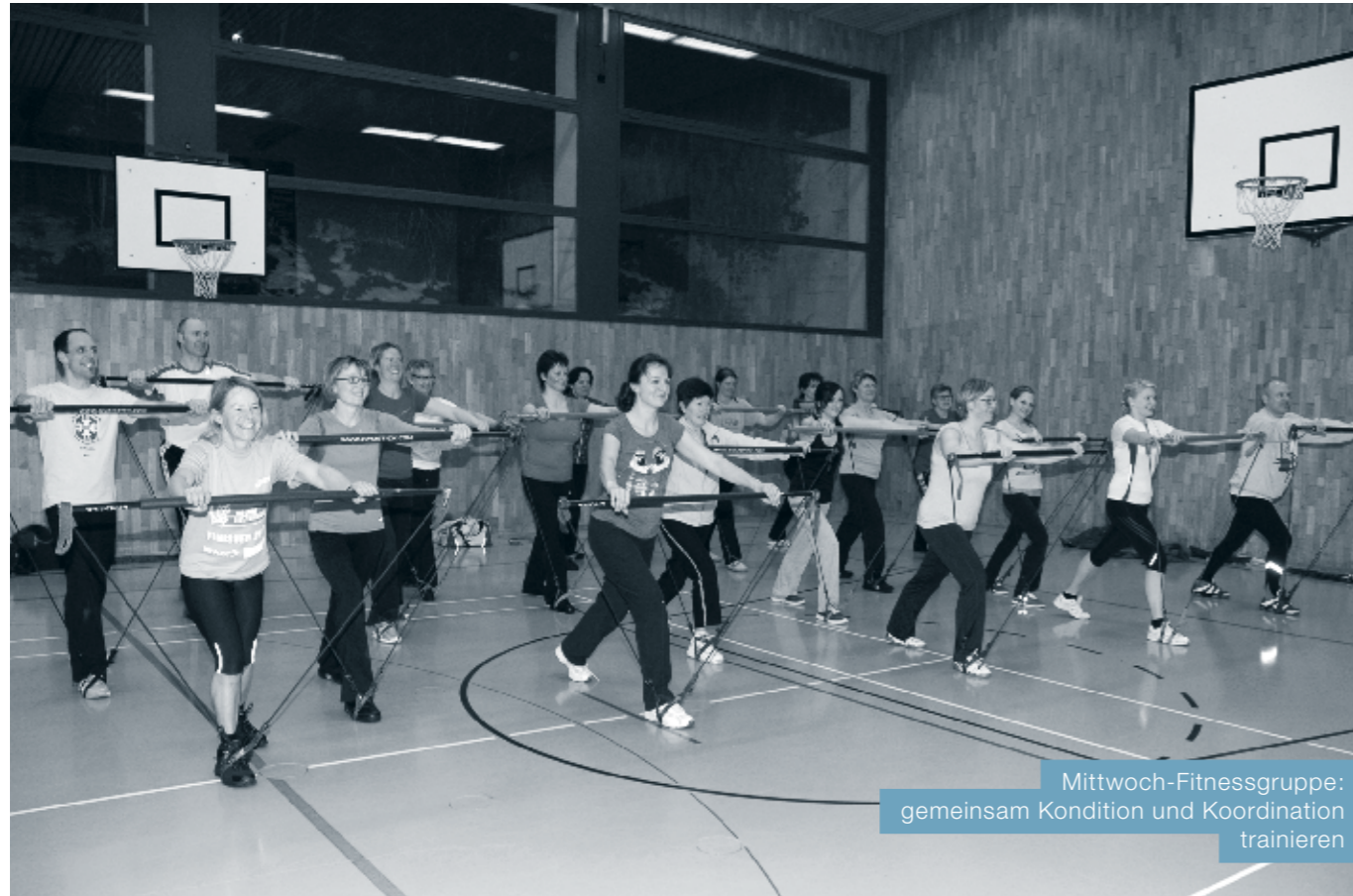
Mittwoch-Fitnessgruppe: gemeinsam Kondition und Koordination trainieren