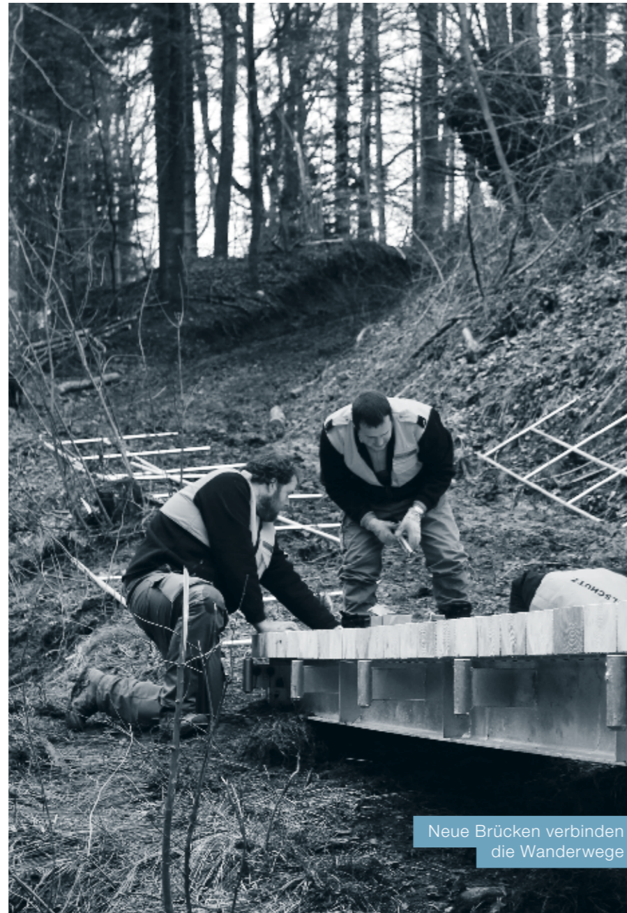
Neue Brücken verbinden die Wanderwege

Die Pioniere des vierten Zuges der Zivilschutzorganisation EMME, zu welcher auch Udligenswil gehört, leisteten mehr als 150 Manntage im Auftrag der Gemeinden. Brücken wurden gebaut, Wanderwege saniert und Bäche renaturiert. Im Fokus der Arbeiten stand das Seetal, das seit Anfang des Jahres neu zur ZSO EMME gehört. So definierte zum Beispiel die Gemeinde Schongau