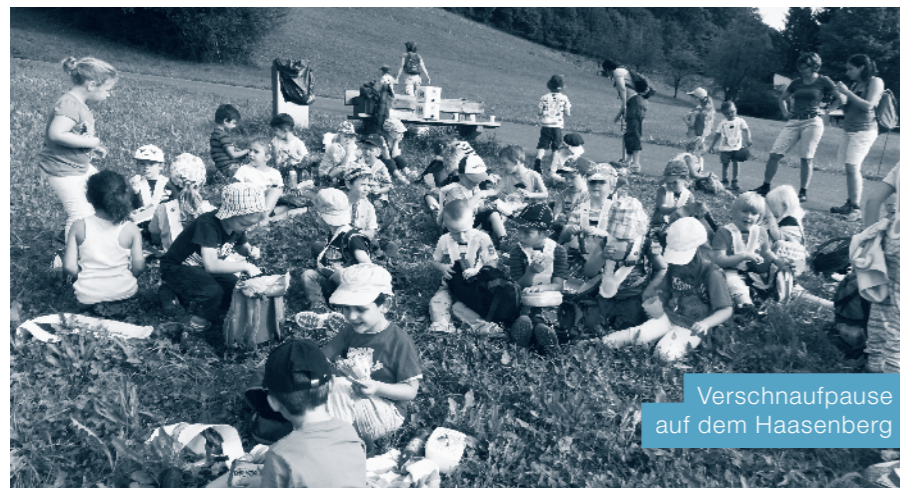
Verschlaufpause auf dem Haasenberg

Zwergenhäuschen. Danach wanderten wir in Richtung Haasenberg. Auf dem Weg kamen wir an Hirschen vorbei, die wir eine Zeit lang beobachteten. Ab und zu hielten wir an, um die Bäume, die wir in der Schule kennenlernten, anzuschauen. Beim Haasenberg gab es dann ein Glas Most. Gestärkt liefen wir danach zum Kirchenspielfeld. Da spielten wir noch ein bisschen. Am Schluss trafen sich alle Klassen wieder auf dem Schulhausplatz, wo wir noch eine Geschichte über die Septemberfee hörten und zwei Herbstlieder sangen, um den Herbst willkommen zu heissen.