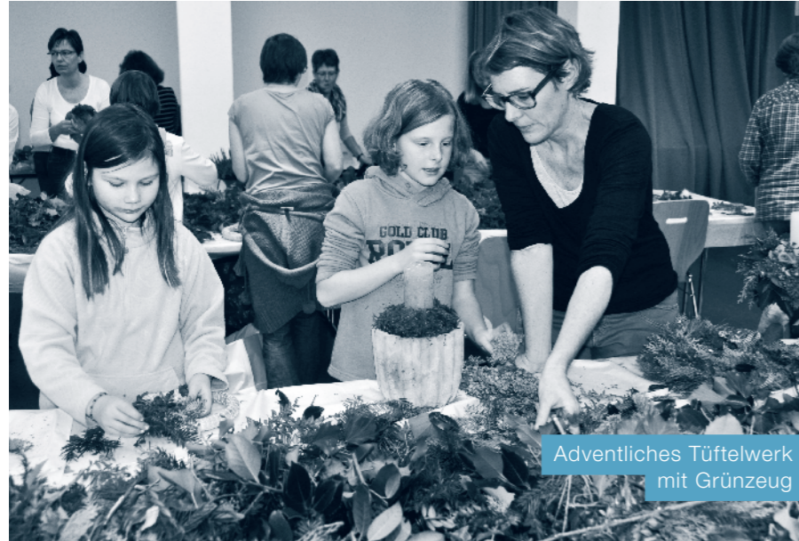
Adventliches Tüftelwerk mit Grünzeug

«Alle Jahre wieder...» laden wir alle, die Lust und Freude haben, sich in die Weihnachtszeit einzustimmen, zum Adventskranz oder Gesteckebinden ein.