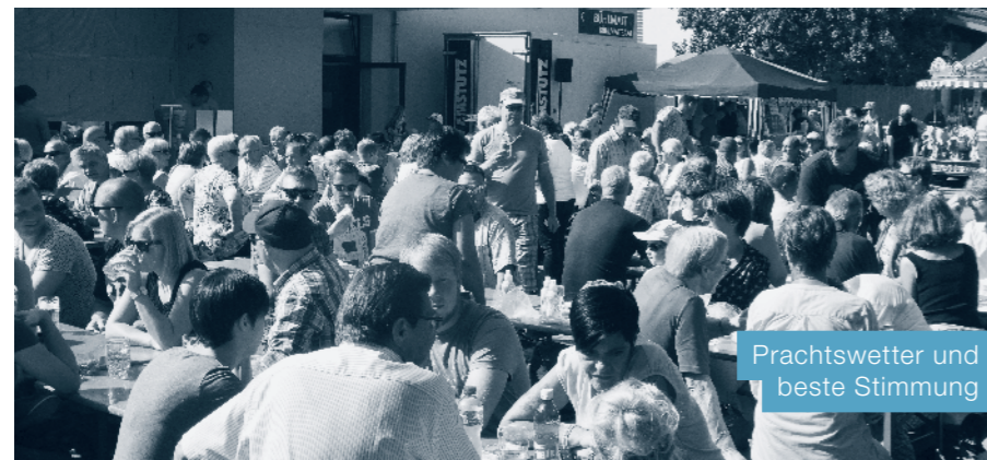
Prachtswetter und beste Stimmung

Am Sonntag, 25. September 2016 fand die traditionelle Musig-Chilbi für Klein und Gross statt. Herrliches Herbstwetter begleitete die Besucher den ganzen Tag. Bei sommerlichen Temperaturen wurde der Chilbi-Besuch ein Fest für alle. Die Feldmusik Udligenswil bedankt sich