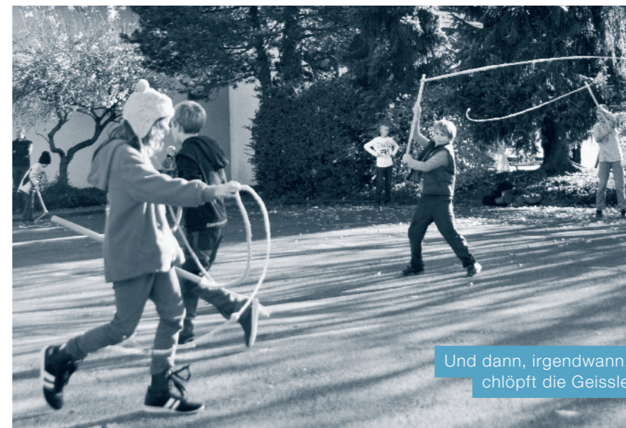
Und dann, irgendwann, chlöpft die Geissle