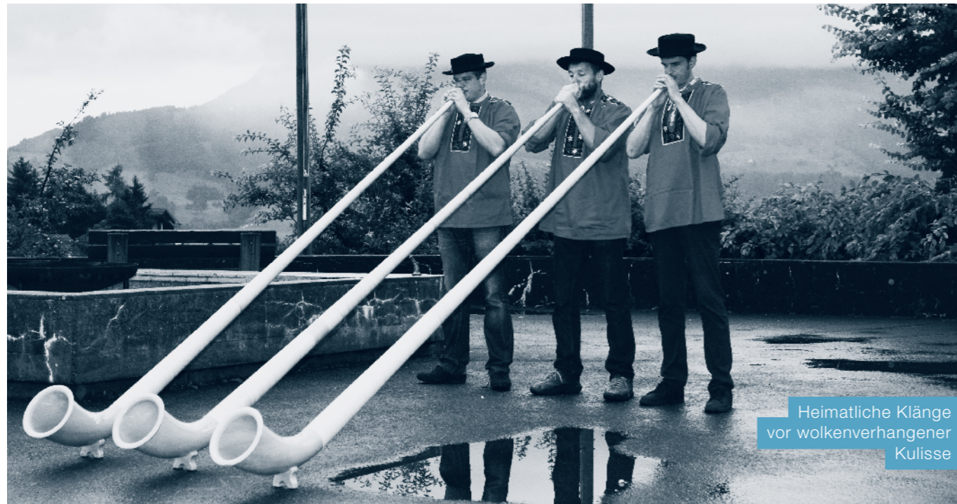
Heimatliche Klänge vor wolkenverhangener Kulisse