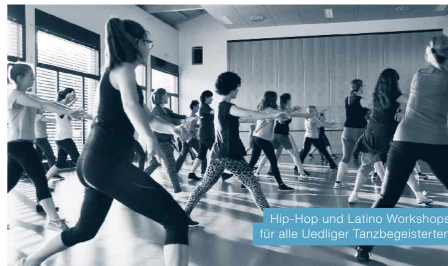
Hip-Hop und Latino Workshops für alle Uedliger Tanzbegeisterten