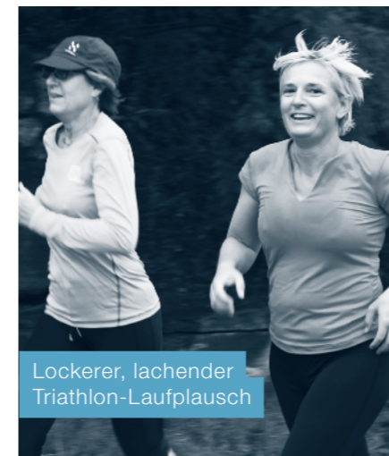
Lockerer, lachender Triathlon-Laufplausch

Am Samstag, 20. August 2016 findet der 28. Plausch-Triathlon in Udligenswil statt. Ein Anlass, der von den Wettkämpferinnen und Wettkämpfern immer mit erstaunlicher Leichtigkeit bestritten wird. Ein Anlass, der von den Fans fre-