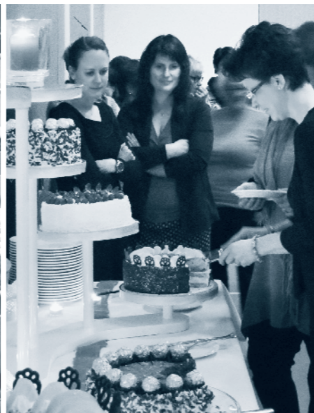
Ob Gemeinschaft oder Netz – Hauptsache, frau trifft sich an der GV