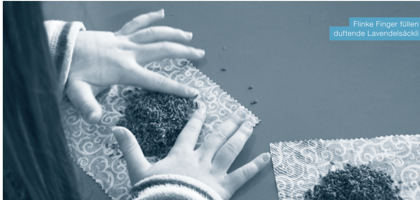
Flinke Finger füllen duftende Lavendelsäckli

Unsere Schule führte in der letzten Novemberwoche eine Projektwoche zum Thema «Wellness» durch. Alle Kinder vom Kindergarten bis zur 6. Klasse beschäftigten sich während einer Woche altersdurchmischte in fünf verschiedenen Ateliers mit dem Thema «Wellness». Nach der morgendlichen Yoga-Übung und dem Zitat für den Tag, starteten die verschiedenen Gruppen in ihren Ateliers.