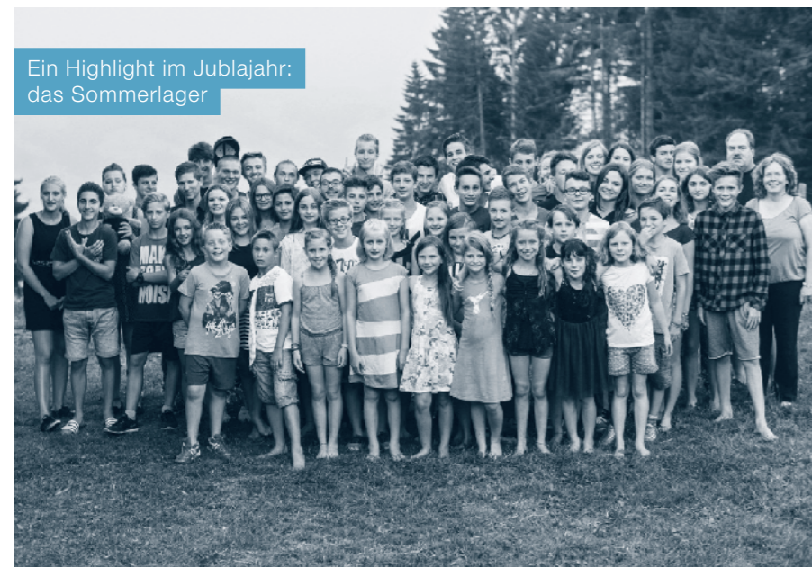
Ein Highlight im Jublajahr: das Sommerlager

2015 ist schon bald zu Ende und wir können auf ein weiteres supertolles Jublajahr zurückblicken. Zu den jährlichen