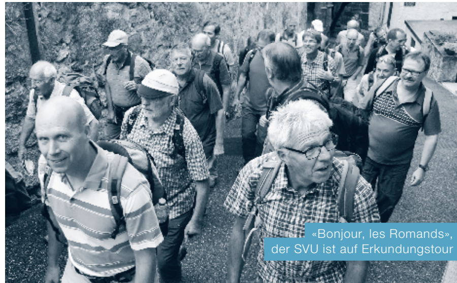
«Bonjour, les Romands», der SVU ist auf Erkundungstour