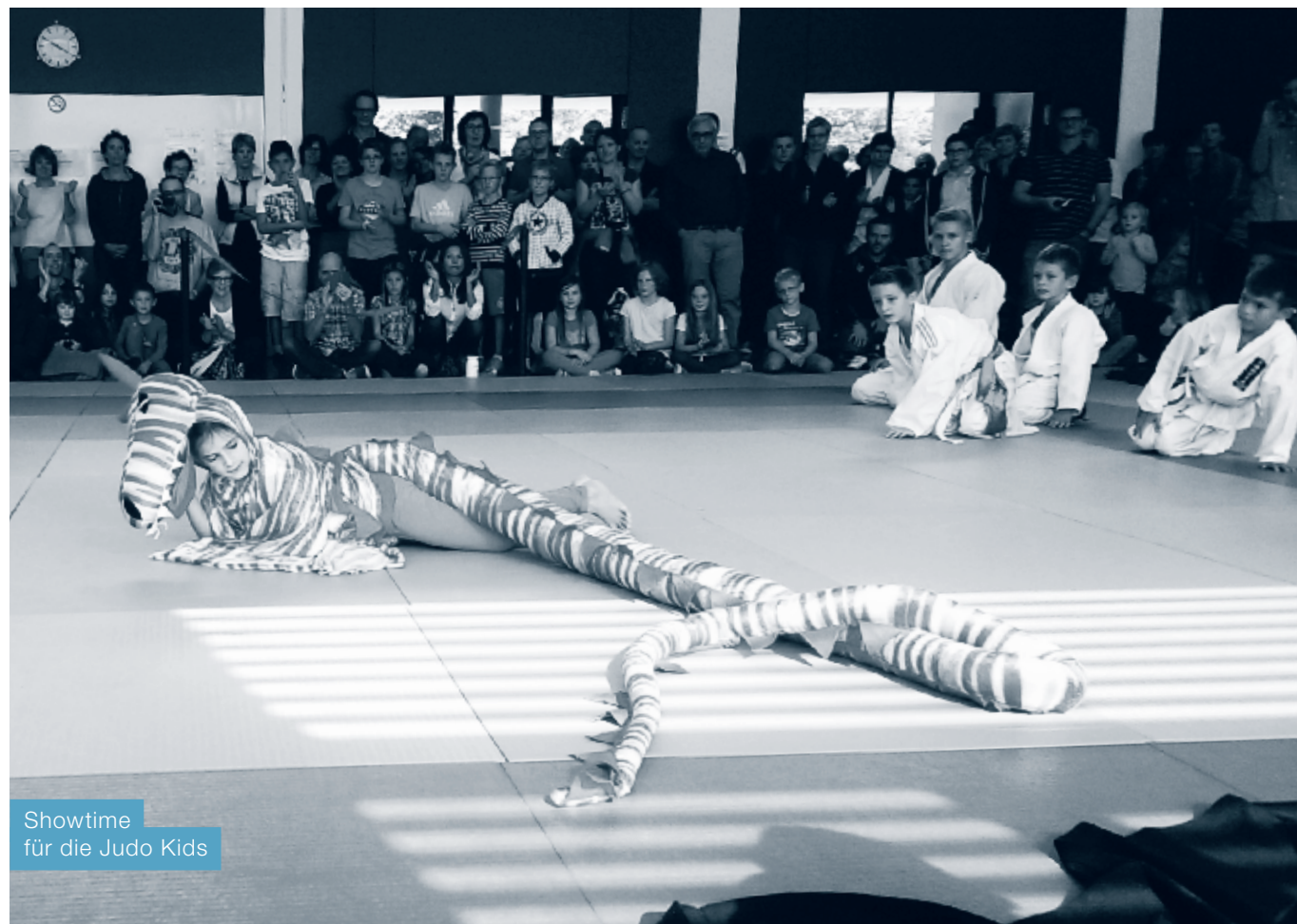
Showtime für die Judo Kids