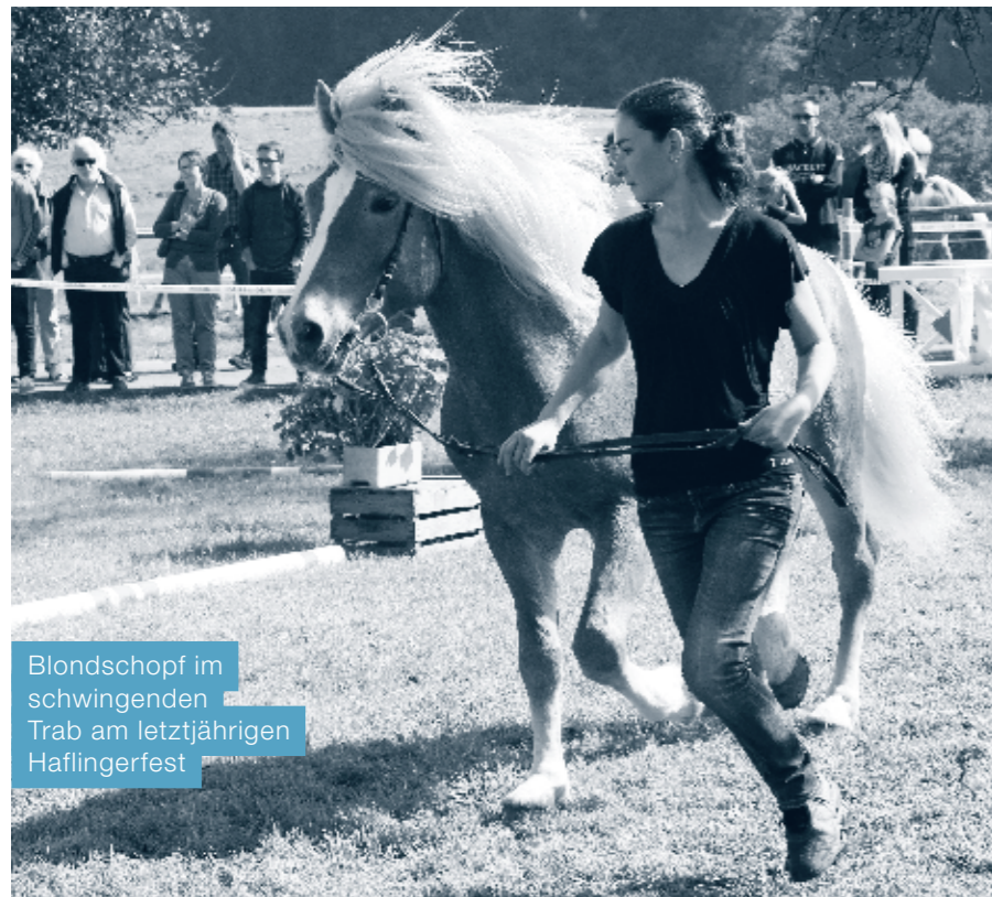
Blondschoopf im schwingenden Trab am letztjährigen Haflingerfest

Am Sonntag, 27. September 2015 findet auf dem Hof Neuheim zum zweiten Mal das Haflingerfest statt. Ab 9.30 Uhr werden die Fohlen mit ihren Müttern vorgeführt und von einer Fachjury beurteilt. Für die Fohlenbeurteilung haben sich Züchterinnen und Züchter aus der ganzen Schweiz angemeldet. Um 13.30 Uhr beginnt die kommentierte Präsentation der Stuten und Fohlen. Für das leibliche Wohl sorgt eine grosse Festwirtschaft