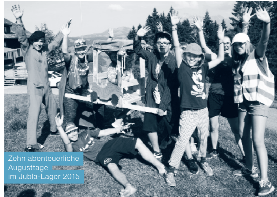
Zehn abenteuerliche Augusttage im Jubla-Lager 2015

Die Jubla Uedlige darf auf ein supertolles, gelungenes und sonnenreiches Lager in Ebnat-Kappel (SG) zurückblicken. Es ist erstaunlich, wie viele hochrenommierte Wissenschaftler es in der Welt gibt und gab, die nicht wissen, wie man eine von Alfred Einstein gebaute Zeitmaschine flickt. So wirbelte es uns zehn volle Tage lang durch Raum und Zeit, bis wir endlich das verlorene Teil und die dazu passenden Tüftler gefunden hatten (oder war es umgekehrt? Keiner weiss es...). Das fehlende Stück war jedoch nicht etwa mechanischer Natur, es war die Liebe, welche die Zeitmaschine wieder flickte. Zehn Tage Abenteuer hat uns fest zusammengeschweisst, da reichte die Liebe Ende Lager aus, um die Zeit wieder richtig zu stellen.