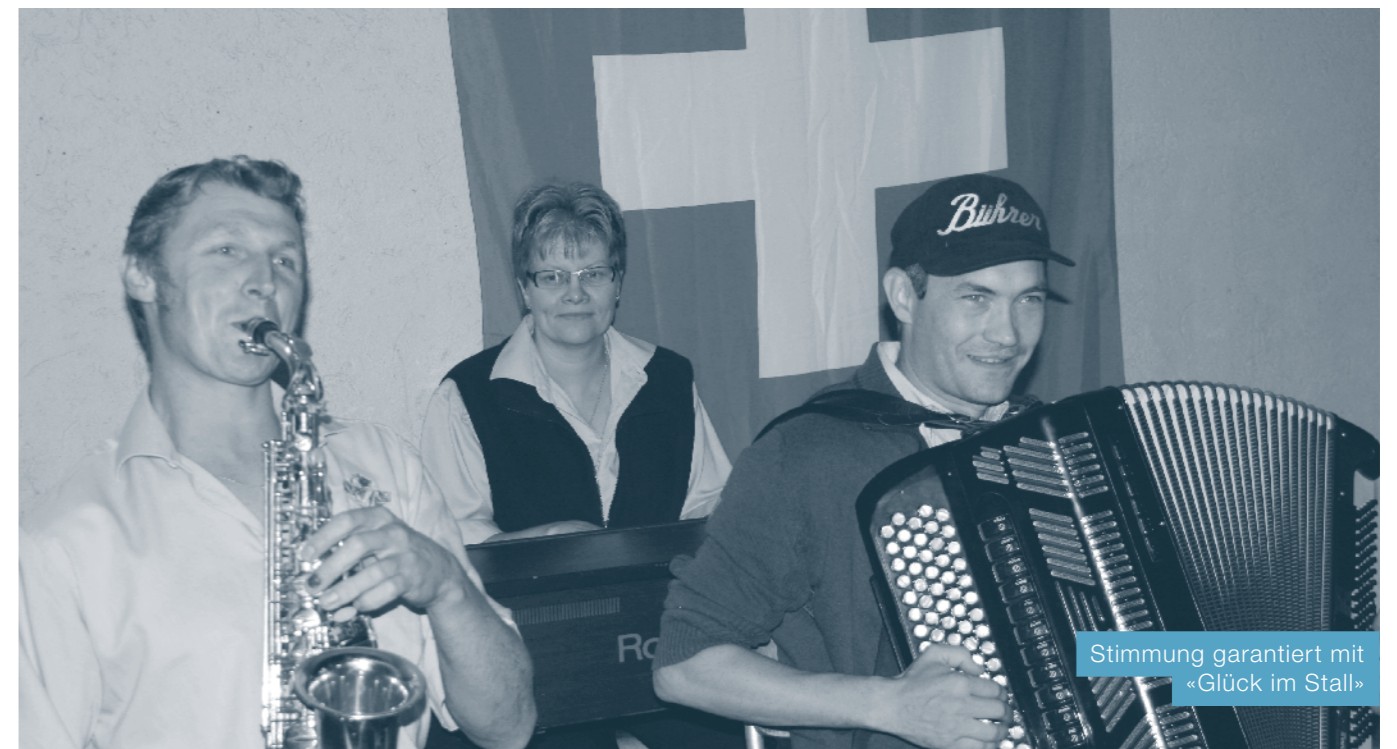
Stimmung garantiert mit «Glück im Stall»

Am 31. Juli 2015 gibts auf dem Kirchplatz ab 19.00 Uhr zu Ehren des Nationalfeiertags urchige Alphornklänge, wohlthuender Jodel, harmonische Blasmusik, wohlgewählte Worte des Festredners, einheimische Musiktalente, stimmungsfördernde Tanzmusik und jede Menge Grillwaren zu geniessen.