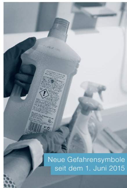
Neue Gefahrensymbole seit dem 1. Juni 2015

Jährlich müssen sich in der Schweiz mehr als 12 000 Personen aufgrund von Vergiftungen und Verätzungen behandeln lassen. Besonders häufig sind Kinder betroffen. Wohlriechende Düfte verleiten zum Trinken einer chemischen Flüssigkeit, Kosmetika und Medikamente werden beim Spielen ausprobiert. Gutes Grundwissen, Disziplin beim Anwenden, Lagern und Entsorgen tragen zum sicheren Umgang bei.