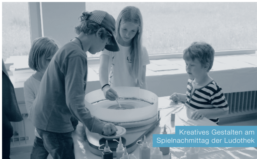
Kreatives Gestalten am Spielnachmittag der Ludothek

len und Schminken. Alle hatten grossen Spass. Bilder finden Sie auf unserer Homepage www.ludo-adligenswil.ch .