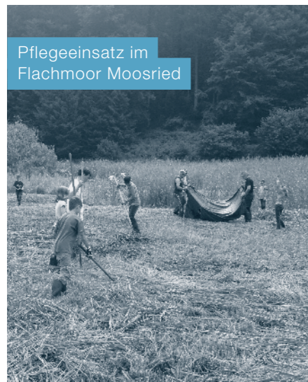
Pflegeeinsatz im Flachmoor Moosried

Die Naturschutzbetreuergruppe Meggerwald sucht Frauen, Männer und Kinder, die Lust haben, sich für die Natur tatkräftig ins Zeug zu legen. Der Einsatz im Moosried zwischen Adligenswil und Udligenswil hat bereits Tradition. Wir pflegen eine stark verschliffene Naturschutzfläche durch einen Frühschnitt, tragen das Schnittgut zusammen und schichten dieses an ausgewählten Stellen zu «Eiablagehaufen» für die Ringelnatter auf.