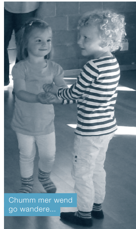
Chumm mer wend go wandere...

Das Singen, Tanzen und Spielen in der Gruppe ist ein Genuss für alle Beteiligten und klingt die ganze Woche nach.