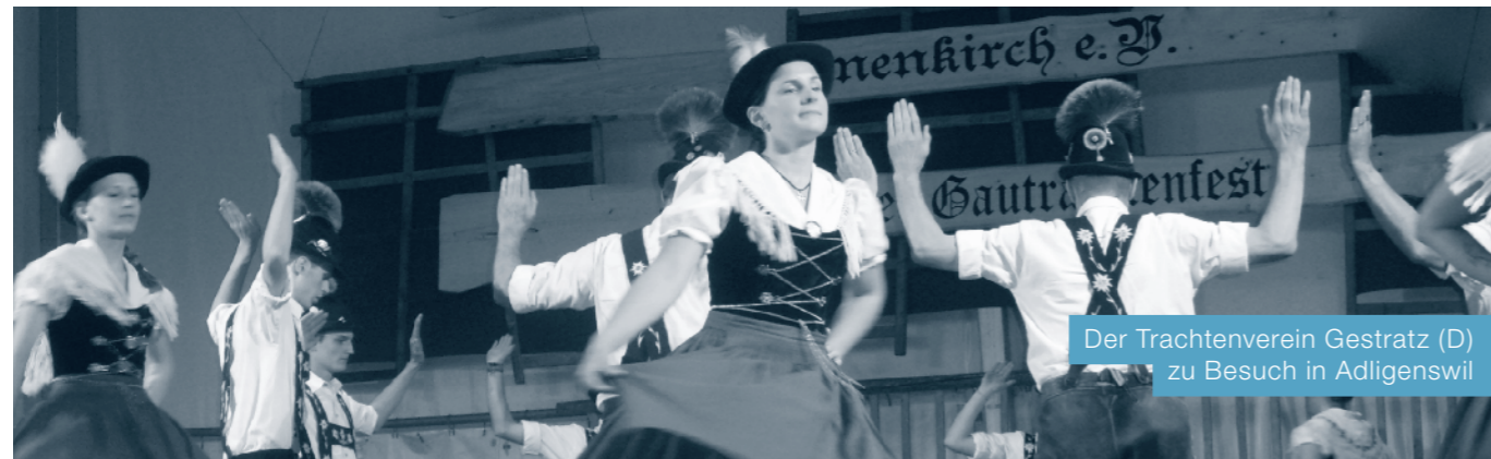
Der Trachtenverein Gestratz (D) zu Besuch in Adligenswil

Unter dem Motto «Tradition mit Schwung», feiert die Trachtengruppe Adligenswil am Samstagabend, 25. April 2015 um 20.00 Uhr mit einem grossen Unterhaltungsprogramm im Saal Zentrum Teufmatt in Adligenswil ihr 80-jähriges Bestehen.