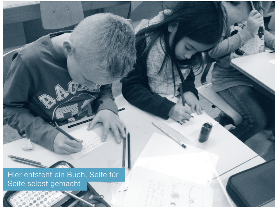
Hier entsteht ein Buch, Seite für Seite selbst gemacht