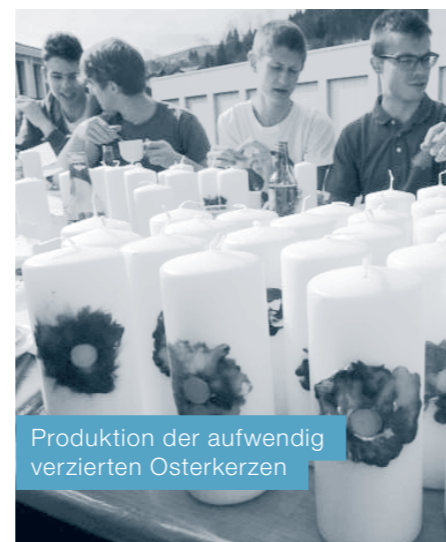
Produktion der aufwendig verzierten Osterkerzen