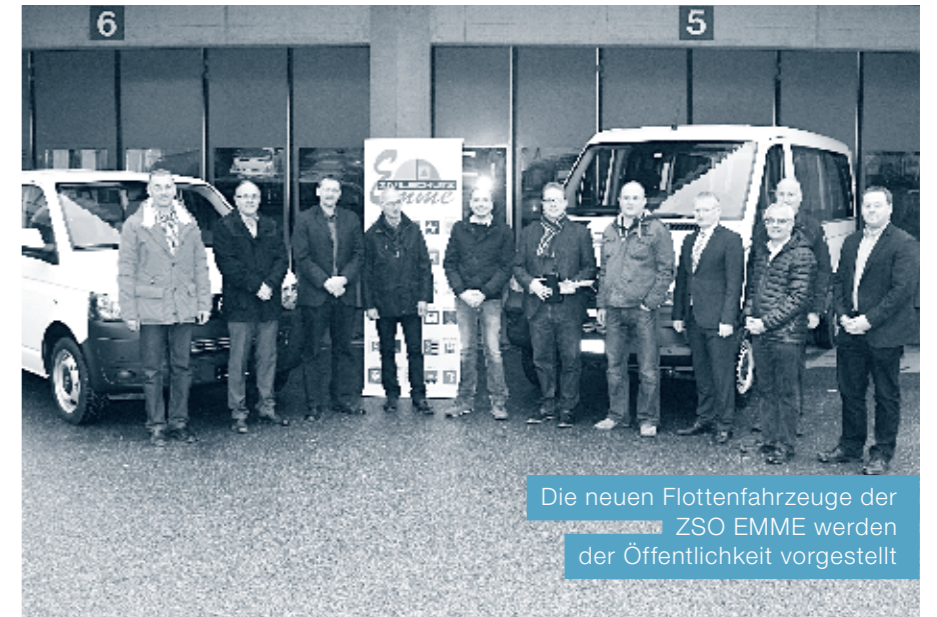
Die neuen Flottenfahrzeuge der ZSO EMME werden der Öffentlichkeit vorgestellt

Die Gesamterneuerung der Fahrzeugflotte ist Teil des Investitionskonzeptes, welches im Rahmen der Fusion der beiden Zivilschutzorganisationen EMME und Seetal zur neuen ZSO EMME per 2013 weitergeführt wurde. Das Flottenkonzept der ZSO EMME ist optimal auf die Bedürfnisse der Organisation abgestimmt und beachtet dabei auch die Schonung der Umwelt. Es ermöglicht sowohl einen Dienstbetrieb wie auch einen Ersteinsatz bei Einsätzen innerhalb des Schutzgebietes der ZSO EMME. Die Flotte umfasst drei Zugfahrzeuge, ein Mannschaftstransportfahrzeug mit 14 Plätzen, 7 Mannschaftstransportfahrzeuge mit 9 Plätzen, ein Kombifahrzeug und ein Dienstfahrzeug.