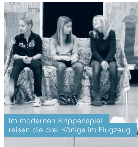
Im modernen Krippenspiel reisen die drei Könige im Flugzeug

Als wir das Theater dann den anderen Klassen präsentieren konnten und dafür gute Rückmeldungen bekamen,