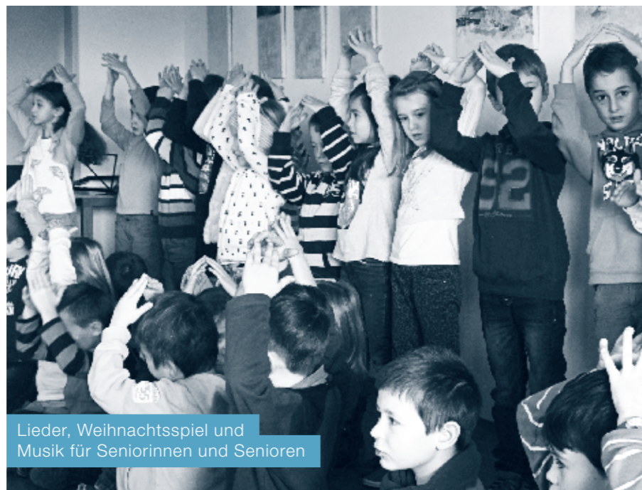
Lieder, Weihnachtsspiel und Musik für Seniorinnen und Senioren

Die Schülerinnen und Schüler der 1. und 2. Klasse haben sich für die Weihnacht 2014 eine kleine Überraschung für die älteren Dorfbewohner am Bächli ausgedacht. In den jeweiligen Klassen und auch gemeinsam haben sie fleissig Weihnachtslieder eingeübt. Am 19. Dezember 2014 war es dann endlich soweit: Im Bächli-Treff durften die Kinder das Geübte dem Publikum vorsingen und vorspielen.