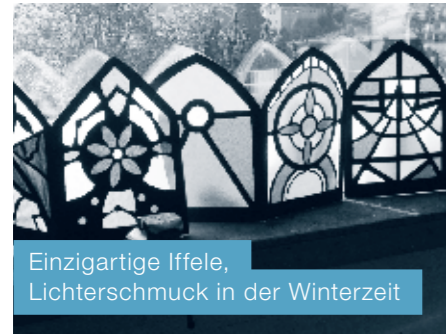
Einzigartige Iffele, Lichterschmuck in der Winterzeit

Unermüdetlich waren die Fünft- und Sechstklässler seit dem Sommer daran, aus Karton und Transparentpapier eine Iffele für den Lichterzug herzustellen. Es wurde gezeichnet, geschnitten, geklebt, gehämmert und einander