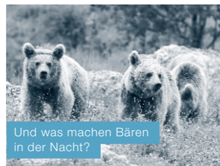
Und was machen Bären in der Nacht?

Kommen Sie mit auf eine ungestörte Runde durch den Tierpark Goldau. In der ruhigen Abendstimmung sind einmalige und spannende Beobachtungen im Tierreich möglich. Ein Ranger bringt Ihnen die dämmerungs- und nachtaktiven Tierarten näher und aktiviert all Ihre Sinne. Sie werden überrascht sein, was Sie alles sehen, hören, fühlen und riechen können.