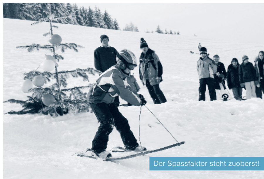
Der Spassfaktor steht zuoberst!