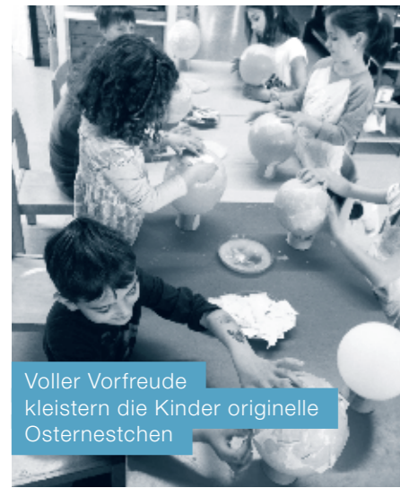
Voller Vorfreude kleistern die Kinder originelle Osternestchen

Während den drei Wochen vor den Osterferien wurde in der Unterstufe am Mittwochmorgen fleissig gebastelt. Wie schon in vergangenen Jahren wurden Osternester hergestellt. Die Kinder konnten wählen, welches von fünf Nestchen sie gerne basteln würden. Einige haben gekleistert, andere mit Stoffbändern und Wolle geflochten. Eine Gruppe hat Tontöpfe bemalt und geschmückt oder ein einzigartiges Huhn aus Packpapier