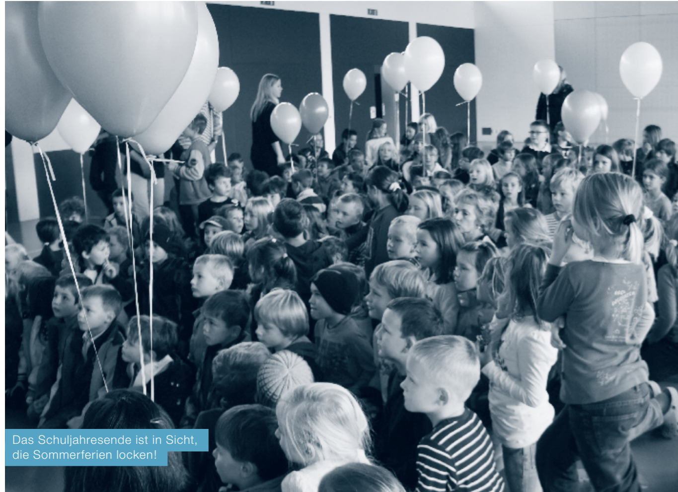
Das Schuljahresende ist in Sicht, die Sommerferien locken!

Dieses Phänomen ist dem Bildungsvorsteher im Gemeinderat vorbehalten.