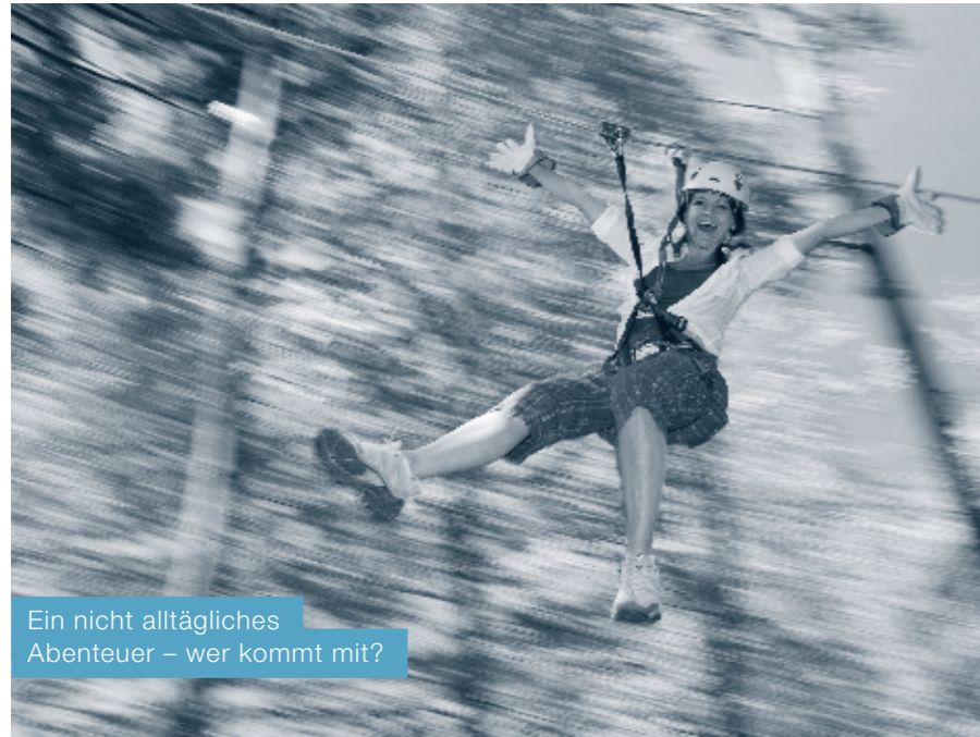
Ein nicht alltägliches Abenteuer – wer kommt mit?

Der Seilpark Rigi oberhalb von Küssnacht umfasst eine Anlage von rund 3.5 km mit sieben Routen in verschiedenen Schwierigkeitsstufen mitten in der Natur. Gemeinsam erkunden wir den Park – sind Sie bereit für ein echtes Abenteuer? Nach der Sicherheitsinstruktion und mit kompletter Ausrüstung starten wir unser persönliches Seilparkerlebnis und lernen unsere eigenen Grenzen kennen.