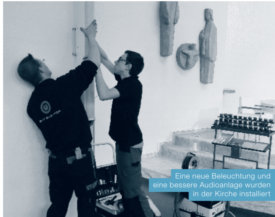
Eine neue Beleuchtung und eine bessere Audioanlage wurden in der Kirche installiert