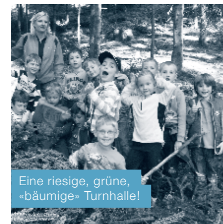
Eine riesige, grüne, «bäumige» Turnhalle!

Bei herrlichem Wetter streiften wir zuerst mit den Kindergärtnern und anschliessend mit den 1. und 2. Klässlern am Donnerstag vor Ostern durch den Wald. Beim Frösche beobachten wurde es ganz leise. Vergnügt hüpfen, sprangen und rannten wir danach weiter, bis wir das Osternest fanden.