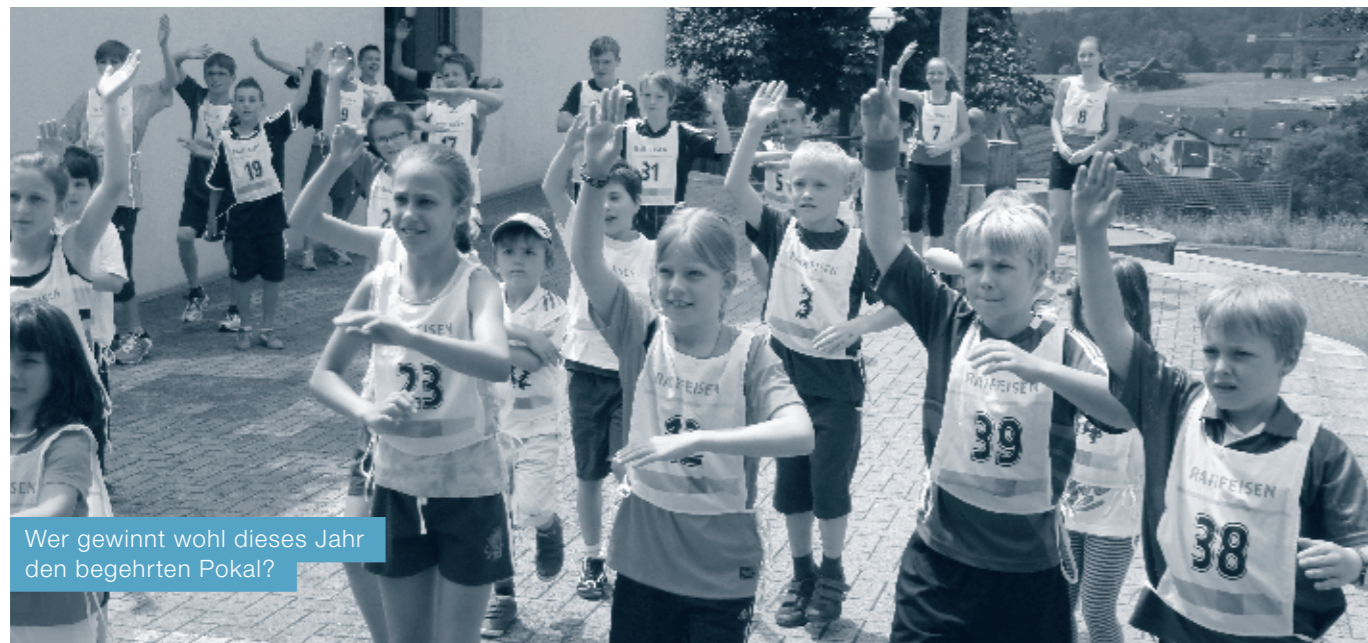
Wer gewinnt wohl dieses Jahr den begehrten Pokal?