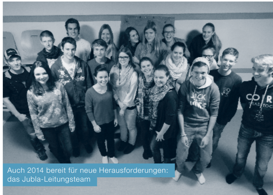
Auch 2014 bereit für neue Herausforderungen: das Jubla-Leitungsteam

Letztes Jahr nahmen wir an einem einzigartigen Projekt teil: Jubla.bewegt! Es ging darum, die Jubla zukunftsorientiert zu verbessern. Das Ziel unseres Projektes war und bleibt, die Bekanntheit in Udligenswil zu stärken. Das Projektteam arbeitete in drei Gruppen: Printmedien, Schule und Internet. So vertrat uns die