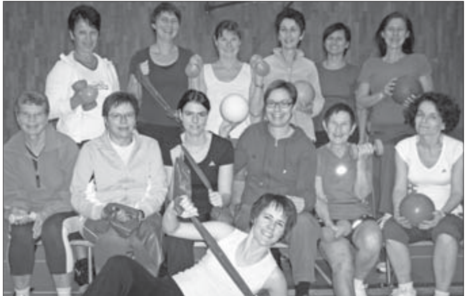
Der Damenturnverein heisst neu FrauenFit Udligenswil .