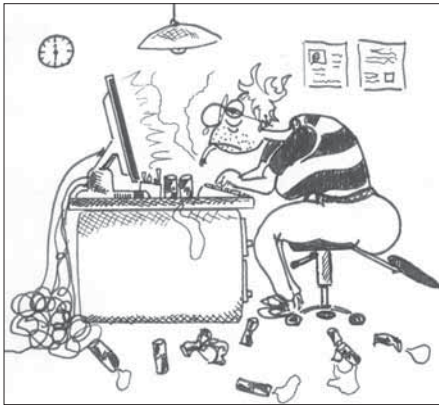
Zeichnung: Kevin Hodel

Während der Bürostunden darf nicht gesprochen werden. Ein Angestellter, der Zigarren raucht, Alkohol in irgendwelcher Form zu sich nimmt .....gibt Anlass, seine Ehre, Gesinnung, Rechtschaffenheit und Redlichkeit anzuzweifeln.