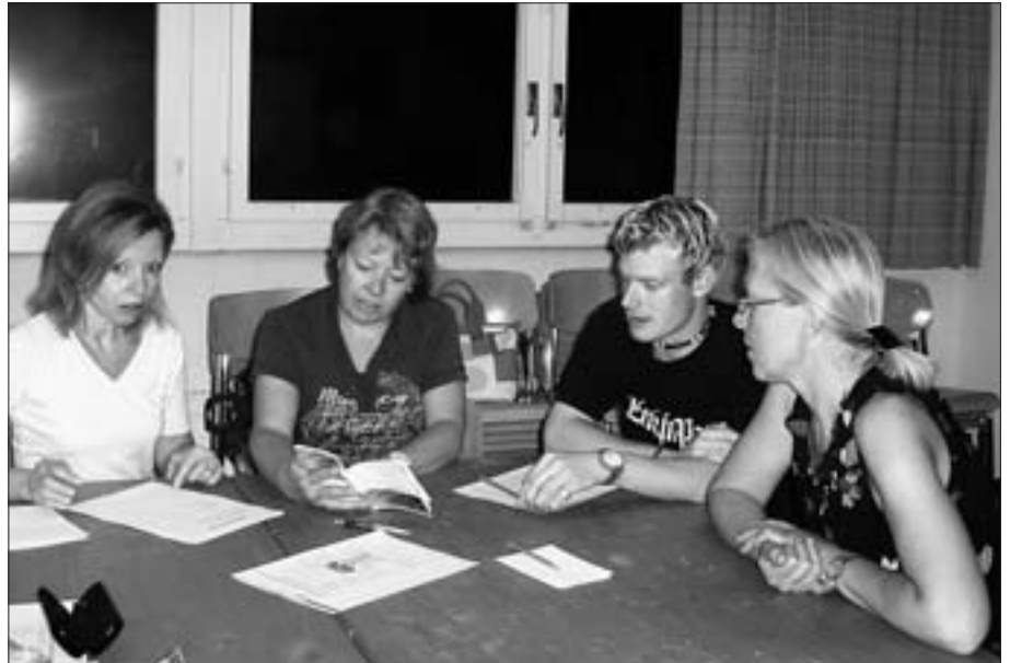
Vereinsübung: Erarbeiten des Themas Schädel-Hirn-Verletzung in der Gruppe.