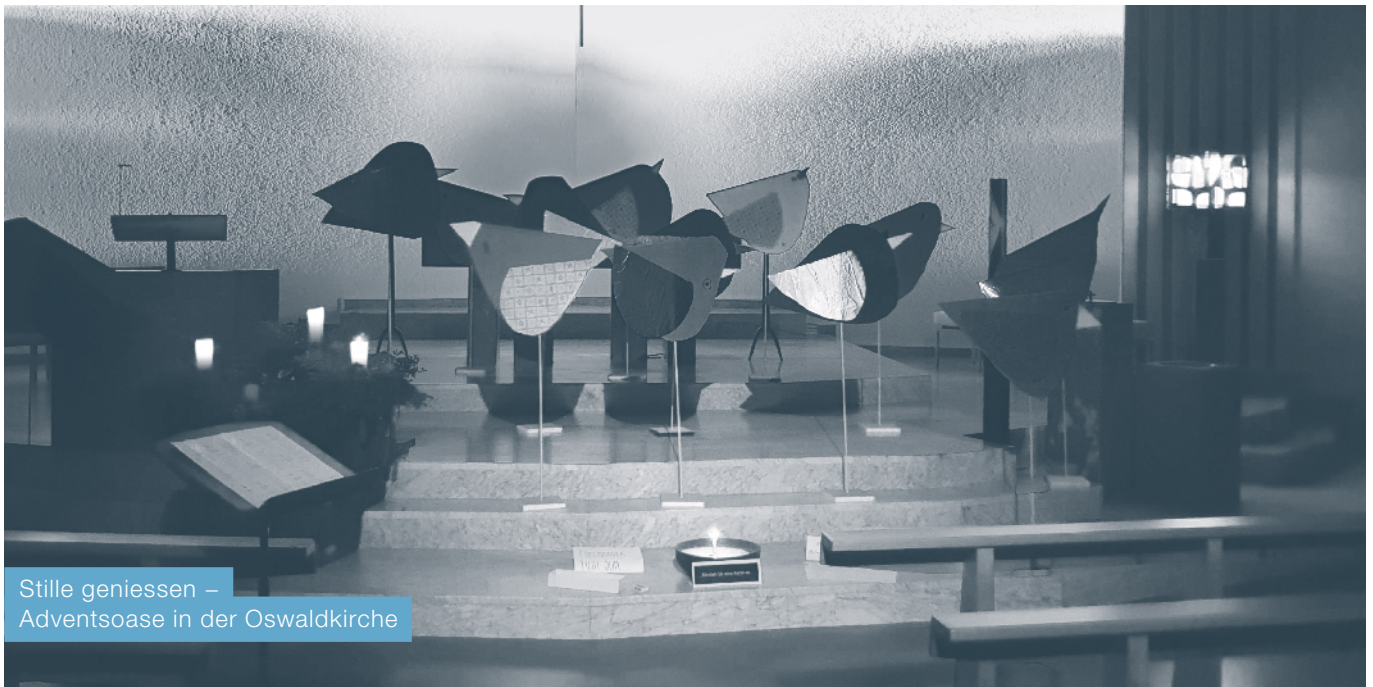
Stille geniessen – Adventsoase in der Oswaldkirche

Situationsbedingt wurden folgende Anlässe bereits abgesagt: