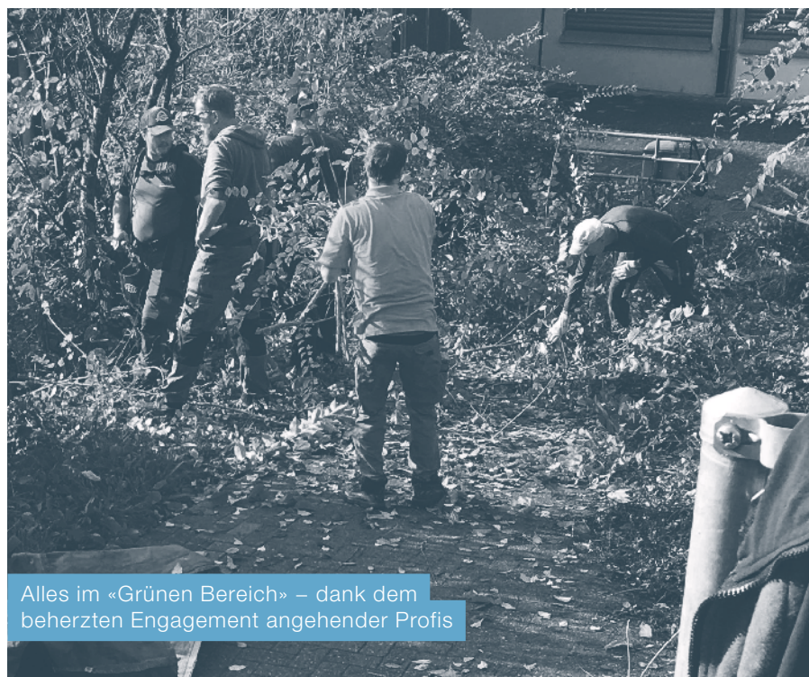
Alles im «Grünen Bereich» – dank dem beherzten Engagement angehender Profis