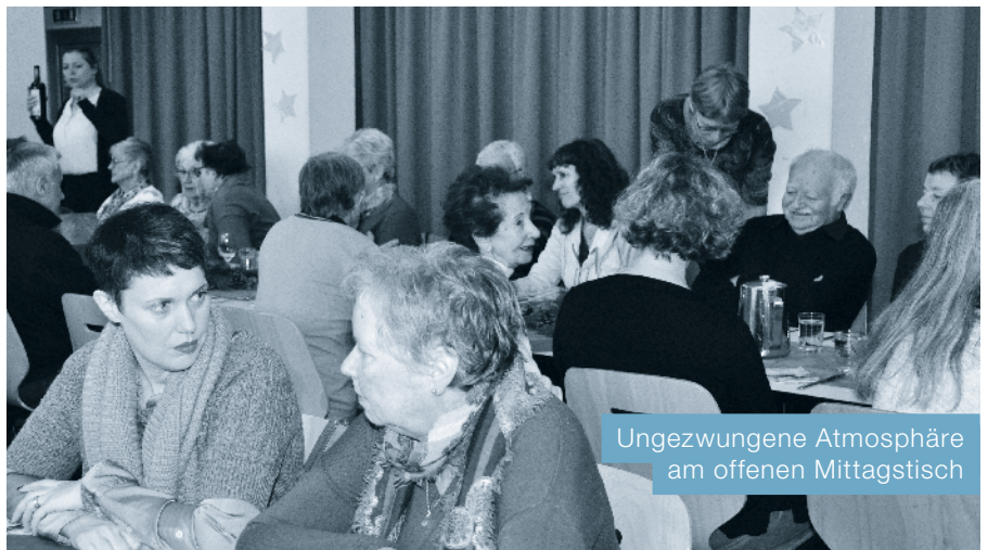
Ungezwungene Atmosphäre am offenen Mittagstisch

Jeweils am Donnerstag von 12.00 bis 14.00 Uhr im Pfarreisaal. Erwach-