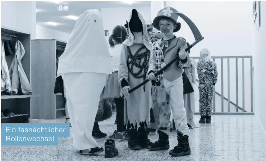
Ein fasnächtlicher Rollenwechsel

Voller Vorfreude erwarteten die Kinder den Fasnachtsanlass, welcher dieses Jahr am Freitagnachmittag vor den Fasnachtsferien stattfand. Es gab kein von der Schule vorgegebenes Thema; die Kinder durften von zu Hause aus ganz nach Lust und Laune verkleidet zur Schule kommen. So trafen in der Schule viele verschiedene «Göiggeli» zusammen: Sportler, Hexen, Clowns, Cowboys, Köche und viele närrische Sujets mehr. Auch die Lehrpersonen warfen sich in Schale – oder treffender gesagt eben ins Kostüm. Nach einem gemeinsamen Start, bei dem die Kindergärtler etwas vorführten, luden in den vorbereiteten Ateliers viele Posten zum Spielen und Basteln ein. Zum Beispiel konnten lustige Masken gebastelt werden, es gab eine gruselige Geisterbahn, ein wortreiches Tabu-Spiel, eine fetzige Disco, ein «1, 2 oder 3», ein Wurfspiel